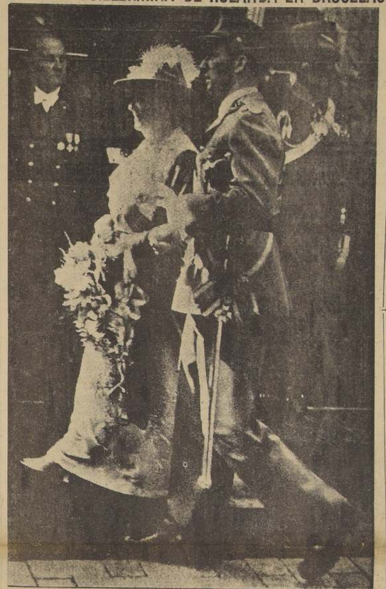
S. M. el Rey Leopoldo de Bélgica acompaña a S. M. la Reina Guillermina de Holanda, al llegar ésta recientemente a la capital belga en visita de Estado.