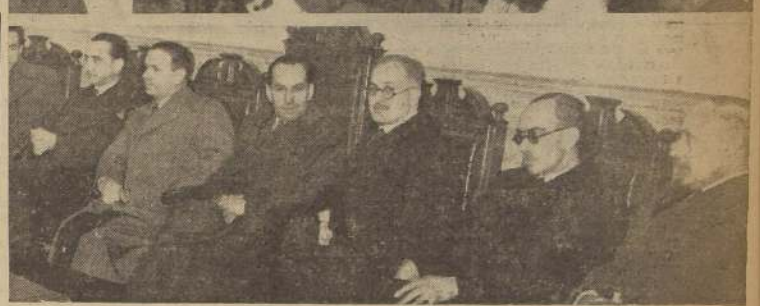
1) El Ministro de Relaciones Exteriores, don Abraham Ortega, en la Legación de Francia acompañado del Excmo. señor Louis de Sartiges y de otras distinguidas personas; 2) Público asistente al acto realizado en el Salón de la Universidad de Chile en honor de Francia; 3) El Director de la Biblioteca Nacional, señor Amunátegui, pronunciando su discurso en la Universidad; 4) La Mesa Directiva del mismo acto.

revolución del 89 y de la proyección que tuvieron sus obras en los pensadores americanos que lucharon por la independencia de las Repúblicas del Continente. Terminó sus palabras recalando la necesidad de tener fe en los principios universales de justicia y de amor a la humanidad.