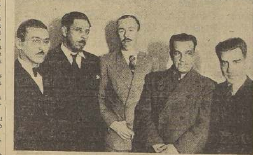
Directorio del Sindicato General de Periodistas