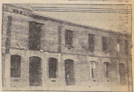
Parte del edificio inconcluso de la Posta "Chacabuco".

Se persigue y llenar así las finalidades que persigue esta institución de Beneficencia.