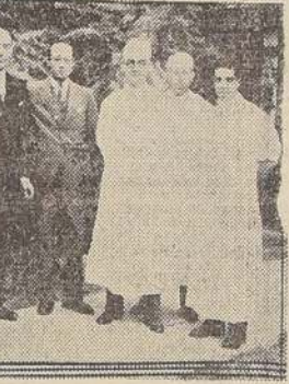
El Intendente y comitiva en la Posta N.º 2.