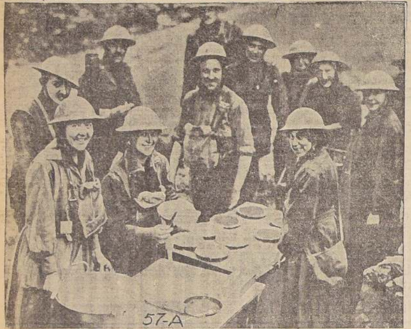
Las representantes del Ejército de Salvación ofreciendo deliciosas tortas de manzanas a los soldados.

A pesar de que contábamos con escaso personal de reparaciones, habíamos dejado en reparación de servicio 13,000 vagones; pero apremiada la necesidad de material de transportes, contábamos con 7,000 vagones y habíamos pedido con urgencia 21,000 más. No obstante, al considerar la carga que pesaría sobre nosotros el año siguiente, cuando tendríamos 3,000,000 de hombres en Francia, insistí en que se nos mandasen con lo