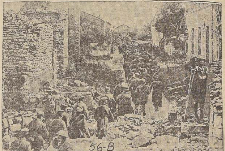
Un fotógrafo improvisado trata de "filmar" el paso de los prisioneros alemanes.

te les proporcionó nuestro pueblo. PERSHING SE OPONE A LOS CAMPOS DE ENTRENAMIENTO EN ITALIA Por la tarde recibí un mensaje telefónico del cuartel general en Chaumont, comunicándome que el Consejo Supremo de Guerra había recomendado que los Estados Unidos estableciesen en Italia algunos campos de entrenamiento para estimular el espíritu patriótico de los italianos. Me opuse, como en ocasiones anteriores, a la dispersión de nuestras fuerzas. Telegrafé mis objeciones al general Foch, quien se oponía también a medidas de esta naturaleza. Temía, empero, que nuestro Departa-