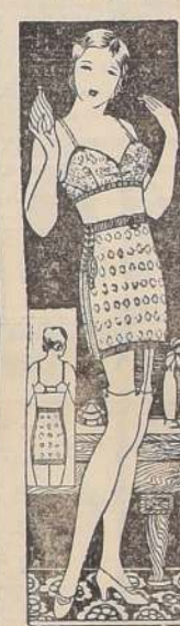
FAJA Nirvana 34, en ricos elásticos muy durables, varios modelos, desde