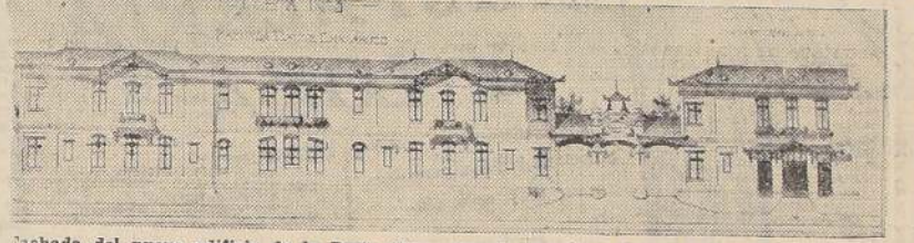
Fachada del nuevo edificio de la Posta "Chacabuco", consultada en los planos.

Con ello quedaría atendido todo el sector urbano de Santiago. — El Intendente Huneeus visitó ayer estos servicios y prometió ayudar a la Asistencia para proseguir las obras.