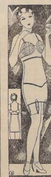
FAJA Nirvana 40, en fino Lasticot, "goma forrada en jersey", a $ 110.00 y