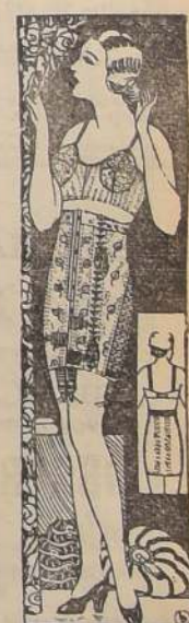
FAJA Nirvana 243. Modelo nuevo, especial para personas gruesas, subido de cintura, muy adelgazador, a $ 50 y $ 28 y