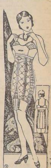
FAJA Nirvana 198. En ricos materiales modelo muy nuevo y muy reductor de estómago, a $ 78.00, $ 52.50 y