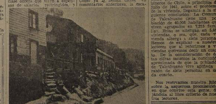
Un aspecto de una de las principales calles de Talcahuano. Arte- ria que conduce al Apostadero Naval.

Nos reservamos nuestro juicio sobre la asquerosa promiscuidad en que convive esta gente, de- jándolo al libre criterio de nues- tros lectores.