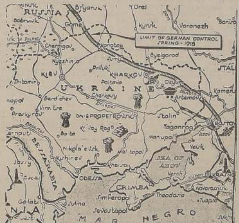
(Correspondencia de William S. Downs, especial para LA NACION)

Después de algunos días durante los cuales no se tuvieron noticias concretas del frente de Ucrania, las fuerzas rusas han lanzado un violento ataque contra Kharkov, tanto de aviación como de artillería. (Mapa del frente sur)