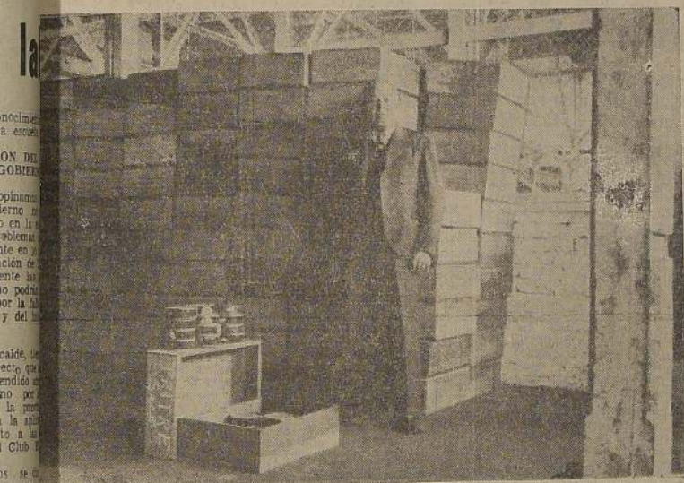
Una de las cajas de los productos en conserva "meckes", listos para ser embarcados a los mercados del país.