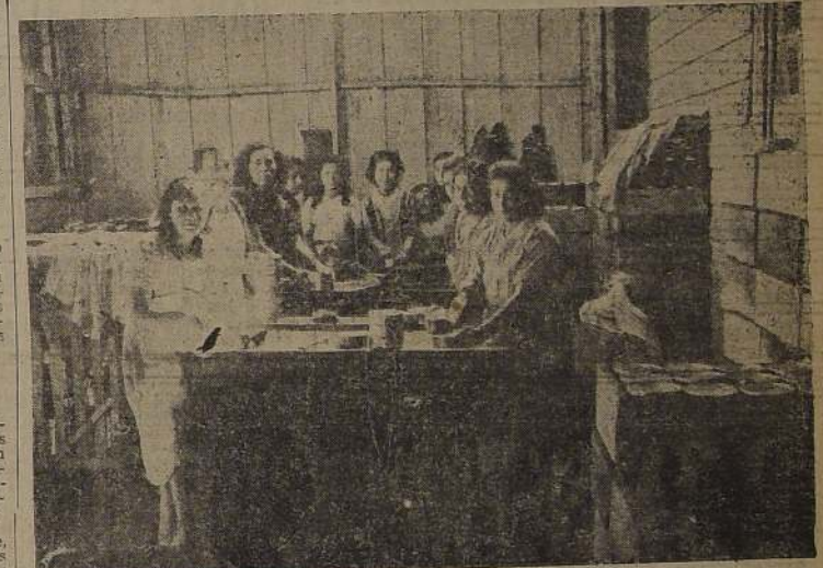
Un aspecto del desarrollo de las faenas de elaboración de las conservas "meckes".

falta de una política que orien- tara sobre las grandes ventajas que este artículo alimenticio sig- nifica en nuestra economía or- gánica.