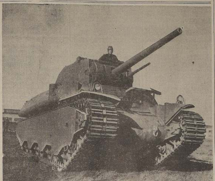
Tanque pesado norteamericano, cuya construcción en grande escala es una demostración del poderío industrial de Estados Unidos, que habrá de pesar en el resultado final de la guerra. Sus potentes cañones y su fácil movilidad, hace de esta arma un elemento de incalculable valor en la lucha moderna

El comando de las fuerzas ar- de las Indias Orientales andesas, que ya han causado a los japoneses más bajas y da- que todos los japoneses de- de China, anunció hoy que se considerará perdido" a otro submarino, el segundo, por no haber sido visto en el mar. El único expresaba que el sume- ro había sido incorporado a la fuerza asística de Gran Breta-