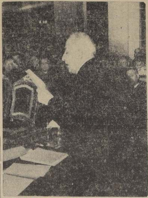
Don Luis Barros Borgoño durante su conferencia de ayer

momentos más graves de su vida nacional.