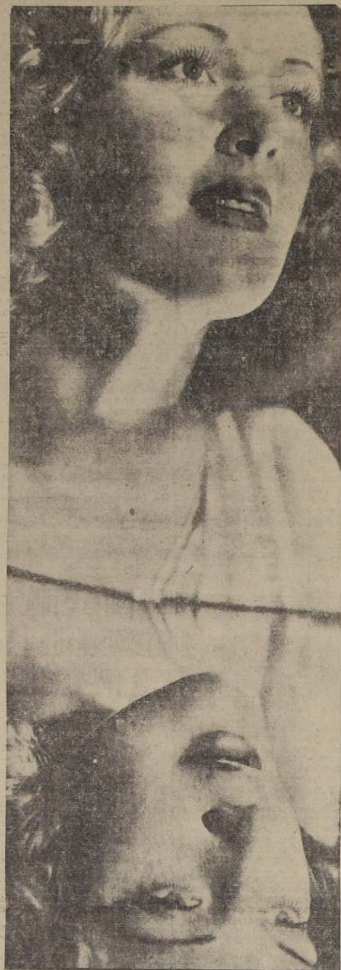
Curiosa fotografía de la encantadora artista Shirley Temple, que representa el principal papel femenino en la película "Nuevos Ricos".

Hollywood, julio de 1938. —"Nunca estuvo más linda", comentan los que observan a Shirley Temple rodando una escena de su nueva película, aun sin título.