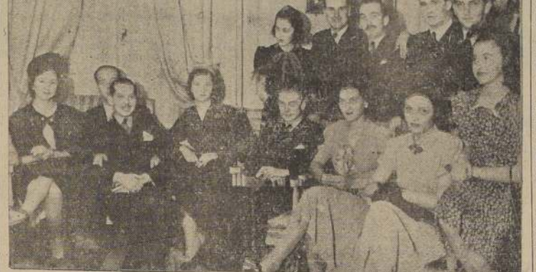
Asistentes al almuerzo ofrecido a la delegación de abogados peruanos por el Consejo de la Unión de Abogados de Chile.