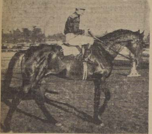
El público tendrá ocasión de ver al crack absoluto de las pistas, hacer su rentree en el programa del domingo, día en que el Club Hípico da comienzo a su tradicional temporada de Primavera, con el clásico "Santiago García Mieres", sobre 1300 metros.