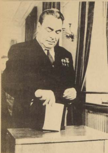
MOSCU (UPI). Leonid Brezhnev emite su voto en las elecciones celebradas en la Unión Soviética para designar a los nuevos miembros ante el Soviet Supremo de la URSS.

NACIONES UNIDAS. 22 (UPI). La magnitud de la ayuda que el Perú recibirá de las Naciones Unidas con motivo de la reciente tragedia sísmica será la mayor que ha otorgado la ONU a un Estado alguno entre los que han sido víctimas de desastres naturales, dijo el Secretario General U Thant. Thant hizo la declaración poco antes de iniciarse esta mañana la sexta reunión extraordinaria del comité plenario de la Comisión Económica para América Latina (CEPAL) que comenzó hoy aquí una reunión de dos días para coordinar la ayuda de socorro y rehabilitación en la región aislada por el catastrófico terremoto del pasado 31 de mayo.