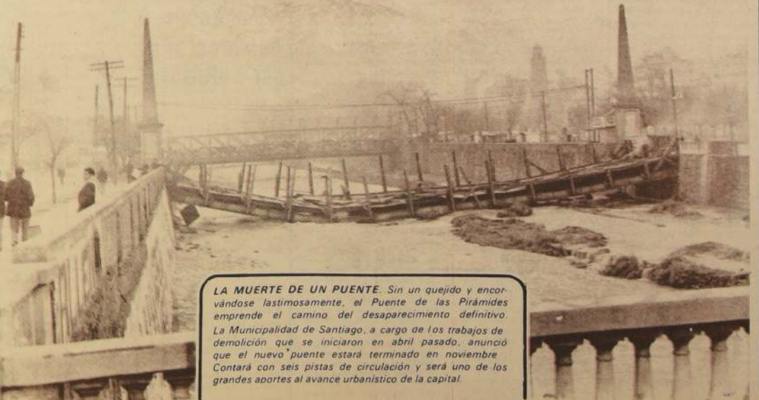
LA MUERTE DE UN PUENTE. Sin un quejido y encorvándose lastimosamente, el Puente de las Pirámides emprende el camino del desaparecimiento definitivo. La Municipalidad de Santiago, a cargo de los trabajos de demolición que se iniciaron en abril pasado, anunció que el nuevo puente estará terminado en noviembre. Contará con seis pistas de circulación y será uno de los grandes aportes al avance urbanístico de la capital.