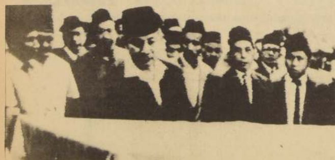
YAKARTA, Indonesia. El Presidente Suharto despidió los restos del ex Mandatario indonesio, Sukarno, que falleció en el Hospital Militar.

La estadística general para los Estados Unidos indica que la tasa delictiva aumentó en el 13 por ciento durante el primer trimestre del año, no obstante los esfuerzos gubernamentales para reducirla, particularmente en ciudades como Chicago, Nueva York y Los Angeles, además de Washington.