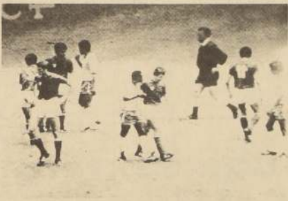
Ha terminado el primer tiempo. El juez alemán Hockner se echa el pelo al bolsillo y no deja lanzar un servicio de esquina. Pelé reclama y conversa con los jugadores italianos.

En cuanto al juego visto en el Estadio Azteca los diarios franceses están de acuerdo en poner en relieve que Brasil brilló en todos sus sectores, incluso la defensa que, aunque tuvo algunos momentos de incertidumbre, anuló completamente a Riva, Gerson, Tostao y el