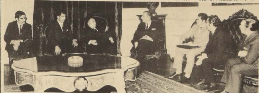
Al Presidente Frei plantearon los dirigentes de los sindicatos de obreros y empleados de la Sociedad "Pizarreño", presidida por el candidato del Partido Nacional, Jorge Alessandri, los problemas suscitados por la amenaza de reducir personal y la jornada de trabajo a cinco días, calificando esto como un problema político destinado a crear malestar e inquietud.