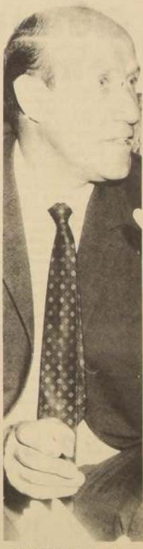
Entrenador alemán Helmut Schön.

No obstante, ambos conjuntos hicieron un gran partido.