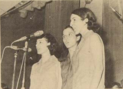
Las muchachas uruguayas y una brasileña cantan, forman parte de "Viva la Gente".