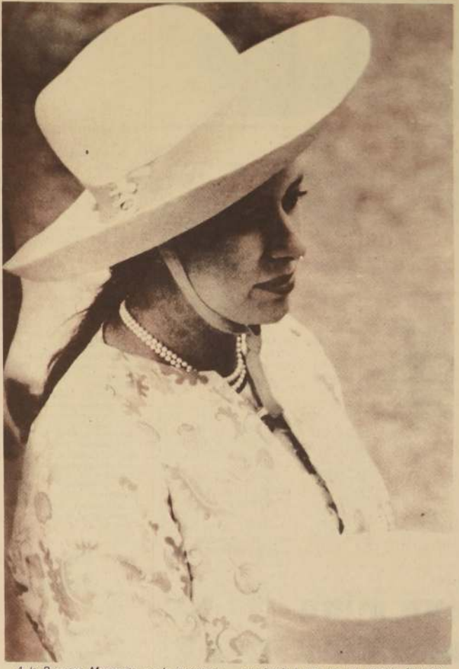
A la Princesa Margarita, no le interesan ni los kilos ni la moda tradicional. Basta ver la fotografía. Fue tomada en las famosas carreras de ASCOT, cuando la hermana de la Reina Isabel lucía un "setson" blanco con una cinta verde que hacía juego con su vestido floreado blanco y verde. El traje sirvió para destacar aún más los kilos que parece sobrarle de acuerdo con la línea imperante.

tal dictado bajo su inspiración en 1946 en uno de sus gobiernos anteriores, fuerzas del ejército ocupaban las universidades de esta capital, Guayaquil y Cuenca, mientras unidades militares patrullaban las calles de las ciudades principales del país. Velasco Ibarra, elegido Presidente por quinta vez en junio de 1968, había asumido el poder el primero de septiembre de ese mismo año. En los últimos días su gobierno enfrentaba una difícil situación como consecuencia de la campaña de agitación emprendida por universitarios izquierdistas y las críticas de importantes sectores empresariales a medidas de emergencia para hacer frente a la crisis económica.