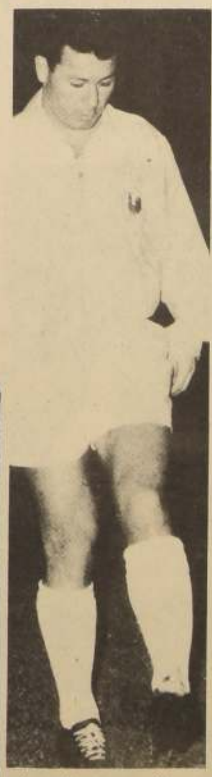
Just Fontaine. Críticas favorables a Brasil.

El entrenador añadió que "Brasil realmente estuvo mejor y mereció triunfar".