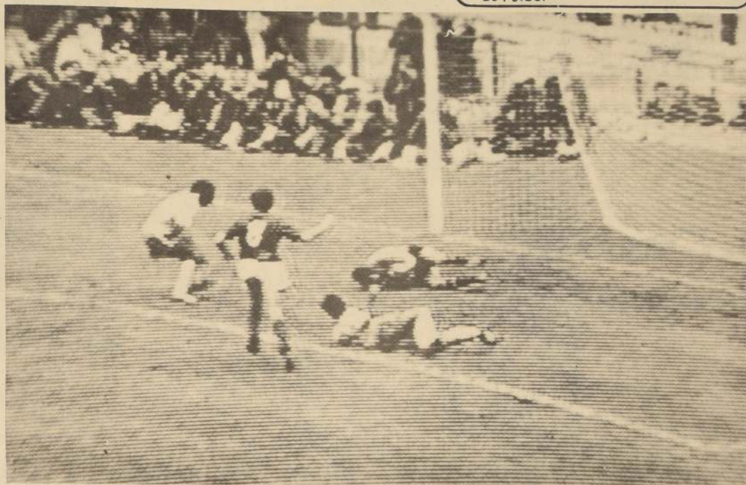
Dispara Pelé y Albertosi: se recoge en el pasto y contiene con seguridad. De los cuatro goles, ni uno solo puede ser cargado en la cuenta del meta.

México (UPI). Apagados los fuegos de las semanas, las emociones frente a los arcos, la alegría de ganar y la angustia de perder, el noveno campeonato mundial de fútbol pertenece ya a la historia, en la cual figura como uno de los mejores torneos de todos los tiempos.