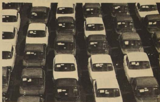
Las fábricas deben disminuir

En diferentes ocasiones Radomiro Tomic se ha referido a la industria automotriz chilena, destacando su importancia en el desarrollo de la economía y de la tecnología nacionales.