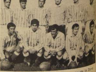
Elenco de San Antonio Unido, campeón de la Zona Norte, que ahora deberá medirse con Bádminton de Cuncu dando comienzo a las finales de la Copa Corbinos

Una vez que la Copa I. Corbinos, tenga dueño, será necesario hacer el balance general de la jornada; entonces se sabrá si la modalidad se ajusta a la realidad del fútbol chileno.