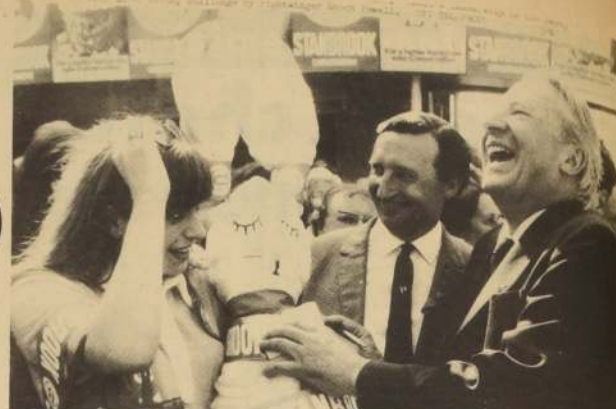
ORPINGTON, KENT. El líder del triunfante Partido Conservador, Edward Heath, nie al firmar sobre un gigantesco conejo frente al cuartel de su campaña.

Heath, al derrotar al Jefe laborista Wilson, no sólo llevó a su partido al gobierno, sino que triunfó contra todas las predicciones.