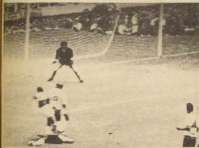
Entre Gerson de atrás y dispara a media altura lejos del alcance de Albertosi. Para Valcareggi este gol fue definitivo.

El público mexicano. Fue un amor valioso. Se apasionó por el juego, mientras éste permanecía en la competencia. Des-