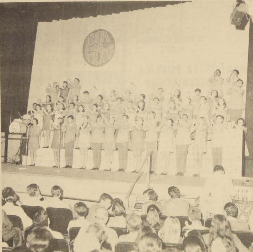
"VIVA LA GENTE", jóvenes de muchos países (menos Chile) ofrecen su mensaje.