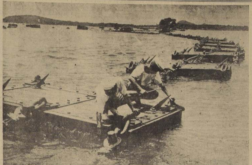
Barrera que se extiende como un cinturón en torno a la isla de Singapur en el Estrecho de Johore. Es uno de los elementos que defienden la fortaleza contra un ataque en grande escala.