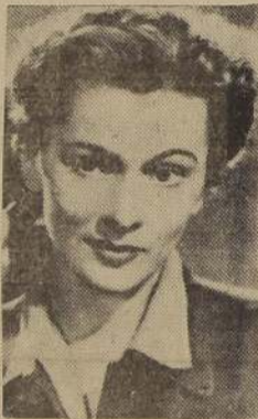
Con todos los honores de una "premiere", Sala Cervantes mostrará esta "Sospecha", desde hoy y en funciones de matinee, tarde y noche.

Paralelamente a la acción de esta muchacha sentimental, se cuenta de ternura, está la del galán, especie de ganster de alto vuelo, hombre de mundo, de maneños turbios, ladrón de corazones y de dinero, y que encuentra en Gary Grant un intérprete fiel.