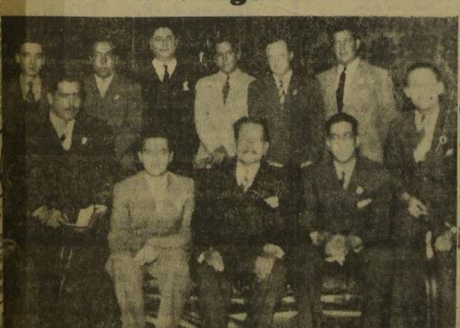
La tarde hicieron una visita oficial al Excmo. señor Aguirre Cerda, los periodistas que intervienen en la Misión Mexicana de Obstetricia en el Hospital S. Borja, que llevará el nombre de "México".