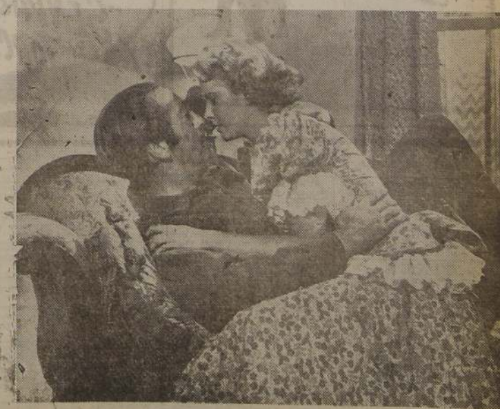
Aún haciendo de bandido en la película en tecnicolor "Calles de Laredo", Macdonald Carey se entrega al amor. En esta escena, Mona Freeman se abandona en brazos de Carey, ignorando que es un facineroso al que las autoridades han puesto precio a su cabeza. William Holden y William Bendix figuran en el reparto