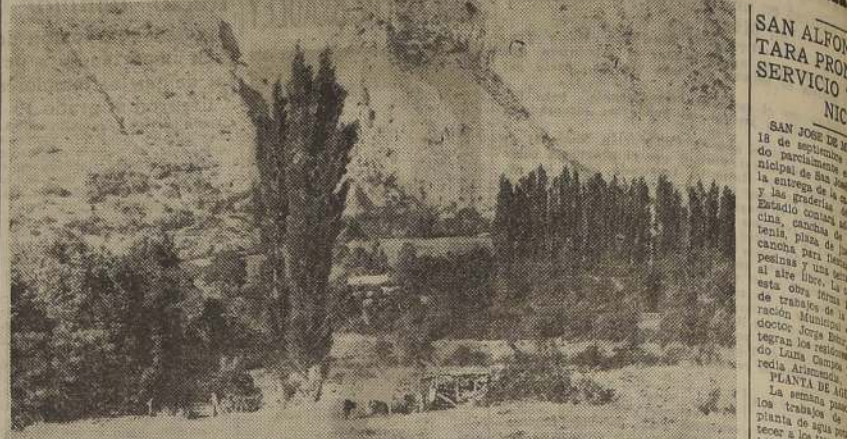
Hermoso aspecto del balneario cordillerano de San Alfonso, en los parajes del Cajón de Maipo, que, a partir del próximo mes de mayo, tendrá servicio telefónico.