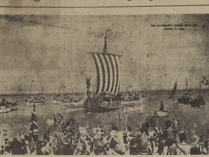
Invasión muy bienvenida fue la realizada por 53 marinos daneses que desembarcaron recientemente en Marín Main Bay, Inglaterra, después de navegar durante diez días a través del Mar del Norte, en una réplica de las famosas galeras de los vikingos normandos.