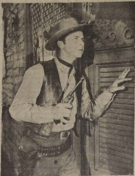
Dick Powell, héroe central de la nueva película de R. K. O. Radio Picture.

Dick Powell y Jane Greer, son los protagonistas estelares de esta superproducción de la RKO Radio. "Peor que el hombre", que estrenará hoy el Teatro Central, es una descripción dramática de las luchas que se libraron durante 1880 entre una banda de forajidos, capitaneados por una audaz y temible mujer y un agente secreto y sus hombres de confianza, en las peligrosas regiones de Wyoming.