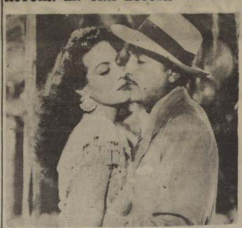
Maria Félix y Arturo de Córdoba se amaron atormentándose y llegando hasta el borde del crimen en "La diosa arrojada", nueva realización de la distribuidora Películas Mexicanas (Chile) Cia. Ltda., que desde hoy se exhibe en el cine Baquedano.