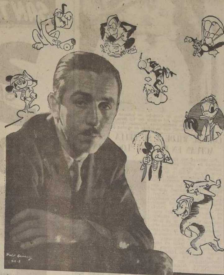
WALT DISNEY y algunos de los célebres personajes que ha popularizado en la pantalla

Walt Disney se hallaba actualmente en Londres donde está produciendo su primera película, "La isla del tesoro", totalmente interpretada por personajes hu-