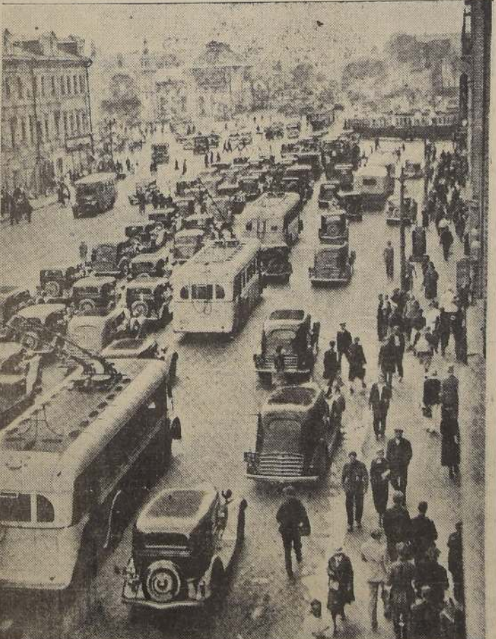
Vista de la Avenida Gorky en Moscú, capital de Rusia, en cuya dirección los alemanes concentran ahora sus esfuerzos.

mano, a varios kilómetros al oeste de Odessa, infligiendo al enemigo una gran derrota. Una partida soviética de desembarco lanzó un ataque que tomó a los rusos por completa sorpresa. Se calcula que los rusos perdieron unos dos mil hombres, entre los que figuraban militares de alta graduación. Las fuerzas navales rusas se retiraron sin ser molestadas, después de haber debilitado al enemigo en la posición de los rusos en el frente de Odessa. LAS ACCIONES EN LENIN. GRADO La Agencia Tass publica un despacho en el que se dice que una de diversas acciones libradas en el frente de Leningrado, es