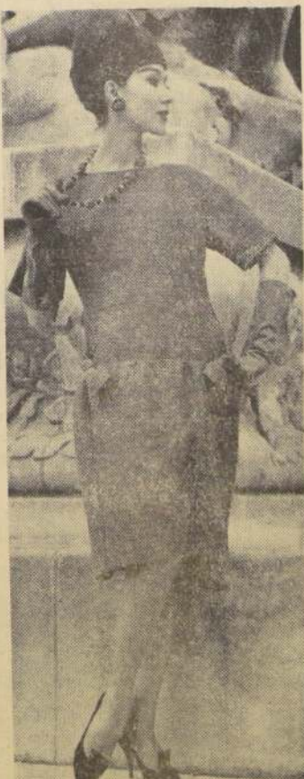
CHAT PERSAN — Vestido modelo de CHRISTIAN DIOR en gasea de lana verde bronceado. El talle bajo lleva dos nudos de la misma tela. Mangas dolman.

En cuanto a las telas, gaseas de lana para el día, junto con etaminas, organdis de lana crepés, tweeds de "encaje". El jersey es la tela ideal para el día.