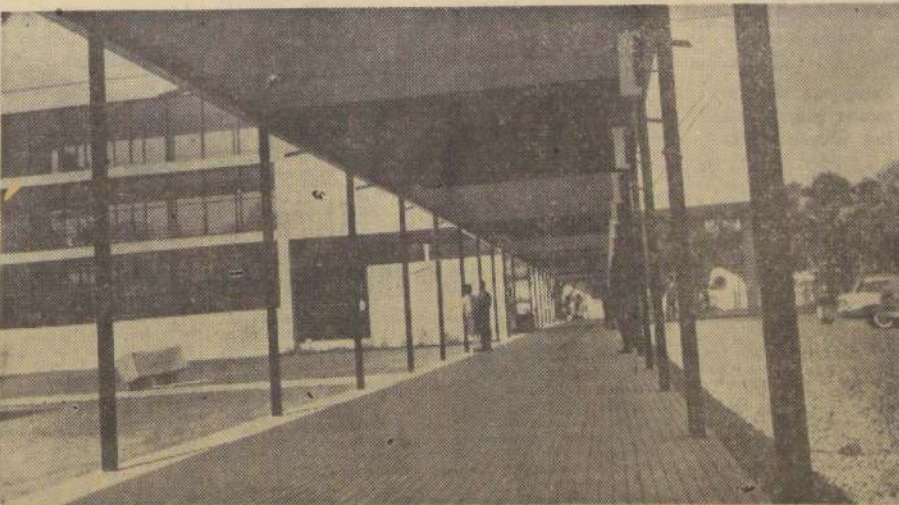
La Unidad Universitaria de Quinta Normal, construida por la Universidad Técnica del Estado, a 20 cuadras del centro, espaciosa y edificada según los más modernos conceptos arquitectónicos, será inaugurada oficialmente el próximo martes en el local del Estadio Técnico. En el grabado, se observa uno de los corredores que comunican los pabellones del Instituto Pedagógico y la Casa Central.