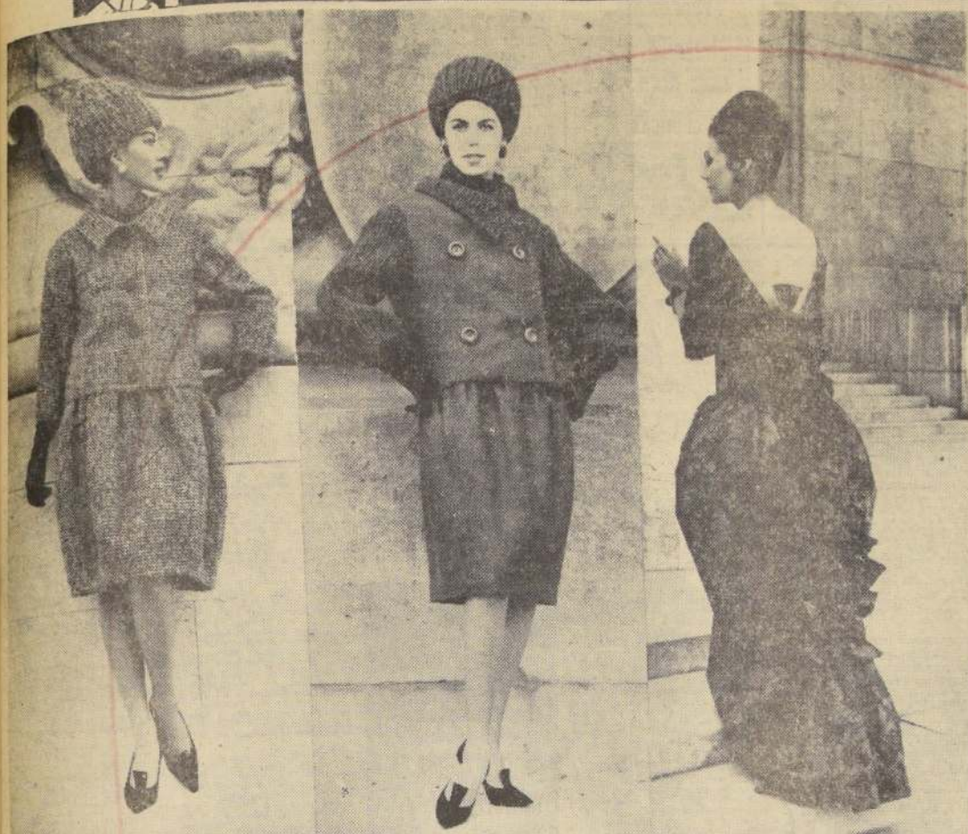
BOBBY (izquierda): Ensamble, creación de CHRISTIAN DIOR, para el otoño, compuesto de vestido y chaqueta de lana a cuadros blanco y negro. La falda, siguiendo la nueva tendencia envolvente, lleva pliegues que se abren desde la cintura. ARDENNES (centro): Ensamble, creación de DIOR, compuesto de vestido y chaqueta, adornada de cuatro grandes botones. Este conjunto está hecho en lana color verde. Las mangas y cuello son de tela repujada que tiene la apariencia de un tejido a paillo. SENSO (derecha): Vestido de noche en taffetas de seda natural imprimé en tono "ciruela", de gran moda en esta temporada. Escote profundo en la espalda. Modelo CHRISTIAN DIOR.