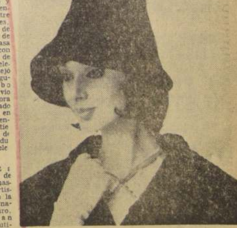
Sombreros muy profundos hundidos en las cabezas graciosamente peinadas se vieron en la Colección de Ayer. Todos son modelos franceses, traídos especialmente por "Los Gobelinos", desde casas parisenses tan famosas como Albouys, Rose Valois, Jeanette Colombar y otras.

CAREN: La línea Pagoda da el tono a la colección que posee una influencia discretamente exótica, aunque muy parisina. Esta línea es esbelta. Sigue el cuerpo, deja el talle en su lugar.