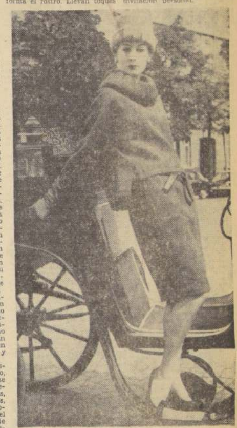
AUTOROUTE — Encantador ensemble para el invierno en lana gris oscura. La chaqueta cerrada, un poco más larga en la espalda, se adorna con un gran cuello de tela imitando lana tejida. Creación CHRISTIAN DIOR.

Esta tarde, a las 17.30 horas, volverá a repetirse la exhibición de modelos de "Los Gobelinos". Será la segunda y última de la temporada y su ingreso a ella es por estricta invitación personal.