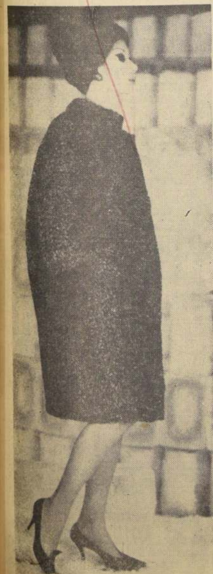
REUNER — Anillo creación de CHRISTIAN DIOR que muestra la línea de la espalda característica para este otoño-invierno. Confeccionado en tweed color gris, se cierra casi hasta abajo con doble hilera de botones.

Podría citarse también con honores a Balmain. Pierre Balmain aporta modelos de gran elegancia. Modisto preferido de las chilenas, sus trajes son característicos por su sencillez y perfección.