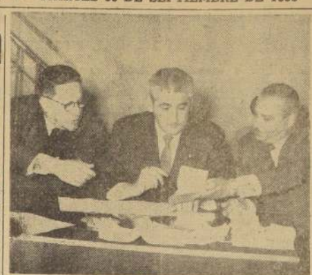
EN SANTIAGO CAYO EL "GORDO". — Ayer se efectuó el Sorteo Extraordinario de Fiestas Patrias, efectuado ayer por la Dirección General de Impuestos Internos en el local de la Pólice Chilena de Beneficencia.