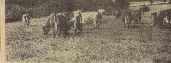
EXCELENTE FORRAJE — La calidad del forraje chileno, ha quedado una vez más demostrada con los resultados obtenidos en la engorda de animales. Las vacunas, especialmente, que consumen este forraje, son ricas en carnes. En el grabado, un grupo de vacas lecheras, pasta en un campo saturado de sol y riquezas agropecuarias.

Otro asunto importante se refiere a la absorción y eliminación de estos complejos polisulfamídicos. Resulta que una