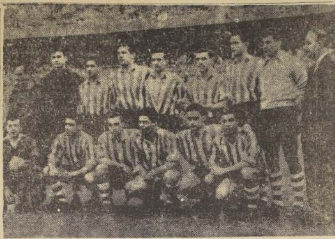
Palais Royal ganó al Club J. San Martín