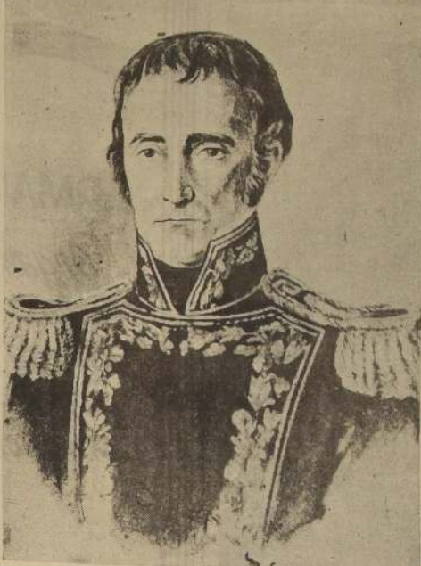
Coronel don Cornelio Saavedra, Primer Presidente de la Junta de Gobierno de Buenos Aires

cuya instalación decía la Audiencia de Santiago constaría por cartas fidedignas y oédulas originales de gracia, y a la cual insinuaba que las provincias hispanoamericanas debían reconocer por centro de unidad de la monarquía.