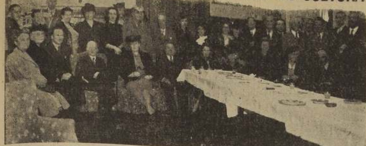
Parte de la numerosa concurrencia con que el Instituto Chileno-Británico celebró su aniversario con asistencia del Excmo. señor Charles Orde.