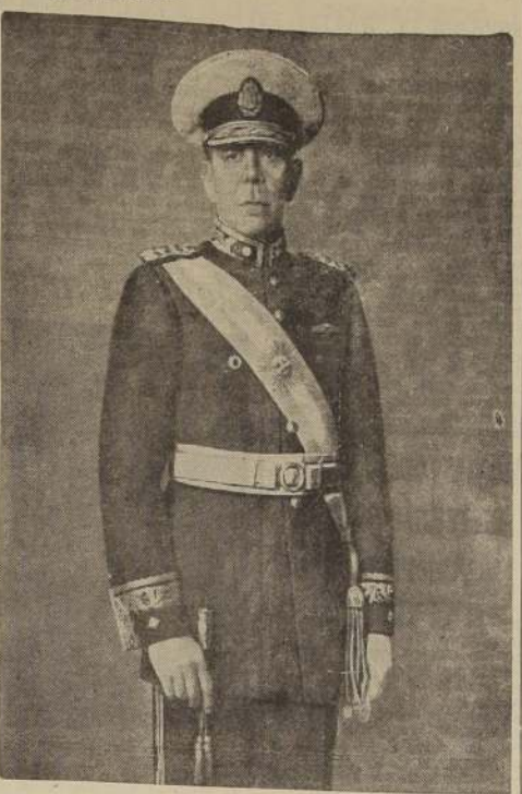
General Edelmo Farrell, Presidente de la República Argentina.