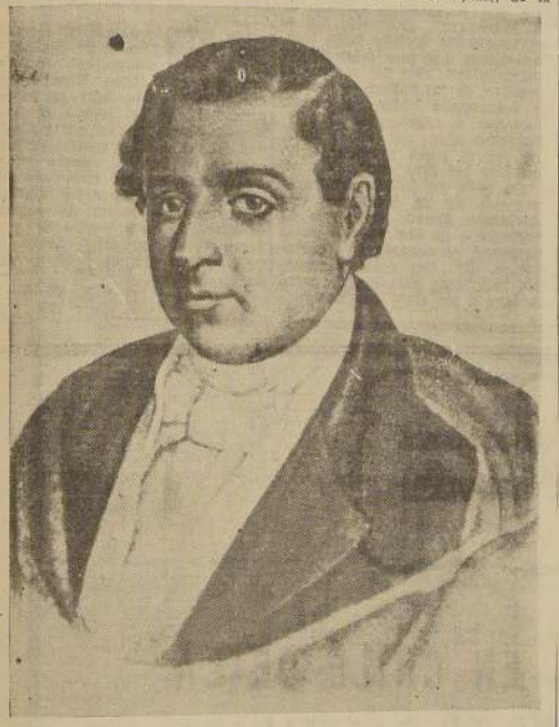
Primer Presidente de la Junta de Gobierno de Buenos Aires Mariano Moreno, Secretario de la Junta de Gobierno

con que los naturales de aquellas vastas provincias han acreditado su amor al rey y a la patria, y en el ardiente entusiasmo y en las fuerzas generosas con que han acudido a defenderlos contra la perfida invasión del tirano de Europa. Penetrada de esta verdad, la suprema Junta gubernativa de España e Indias, desde el principio de su feliz instalación, acordó llamar a los representantes de una y otra India a la participación del ejercicio del poder soberano, y por el real decreto de 22 de enero declaró a nombre de su voz de nuestro amado rey el señor don Fernando VII el número de vocales que debían completar el cuerpo augusto a quien la nación había confiado el supremo gobierno del reino. No satisfecha con esto la suprema Junta, reconociendo que los mismos títulos daban a los naturales de aquellas provincias igual derecho a concurrir a las cortes generales del reino, acordó por su real decreto de 22 de mayo, consultar a los cuerpos y personas respetables del reino sobre la parte que deberá señalarse a aquellas provincias en la representación nacional, sobre cuyo objeto se ocupa actualmente la comisión de cortes, con toda la atención y desarrollo que merece su gran importancia.