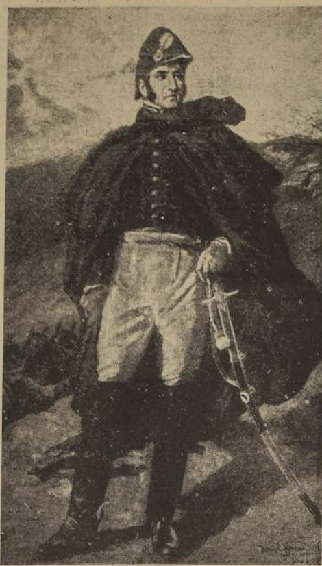
El general José de San Martín, por Daniel Hernández, cuadro pintado en Lima en 1928

Pero ¡guay del que le tocara un pelo de la ropa de servidor de la patria americana! Nadie olvidó entonces su figura que aún en las simples ceremonias oficiales resultaba imponente. Fue el caso de su primer contacto con el gobierno de Buenos Aires en marzo de 1812, apenas desembarcado después de veintiséis años de ausencia. El mismo nos cuenta que los miembros de la Junta "lo recibieron bien, como uno", Rivadavia, Chocó a este su exceso de hombría; el acusado talante de guerrero, su despejo el fuego de sus ojos, su actitud resuelta, "su voz notablemente gruesa y varonil", y desde ese momento se trocó en su adversario gratuito, enconado, siempre alerta e irreducible, creyendo tener en él un verdadero peligro para el porvenir cercano de la revolución en pañales. Es una verdad histórica, bien averiguada, que la figura de San Martín enfermó realmente de miedo la suspicacia de Rivadavia. Años después, indignado el general de que continuase persiguiéndolo aun en el exilio europeo, repelió las injurias dirigidas a su vida de libertador, llamándolo una vez por todas la palabra más terrible que el castellano posee para castigar la ofensa injusta y solapada. La palabra como la figura del criminal, nada tenían de parecido a lo serafico.