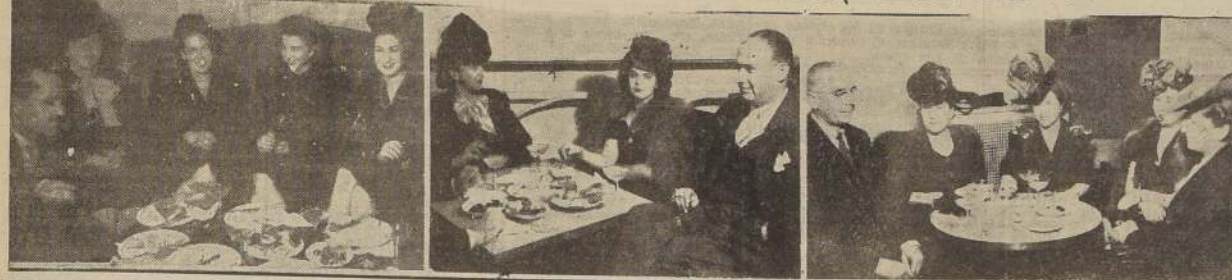
Diversos aspectos de la concurrencia, durante el cocktail ofrecido el miércoles, por la dirección del Crillon, con motivo de la reapertura del salón de té y Bar de ese elegante recinto que abre nuevamente sus puertas bajo una espléndida transformación con todo el confort moderno. Distinguidas familias se congregaron en esta ocasión en el Hotel Crillon que será el punto preferido de nuestra sociedad.

Reclame ..... $ 125 Por 14 K. .... 220 " 18 K. .... 400 " DESPACHAMOS A PROVINCIAS CONTRA REMBOLSO Av. B. O'Higgins 1017