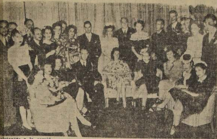
Asistentes a la comida que se efectuó en el Roof-Garden del Hotel, en honor del teniente Edward Dougherty, Agregado Naval a la Embajada de Estados Unidos, con motivo del regreso a su patria.