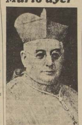
S. E. el cardenal La Puma

ROMA, 5.—(U. P.).—Ha fallecido el Cardenal La Puma, que sufrió hace tres meses de un ataque de apoplejía. Era Prefecto de la Sagrada Congregación de los Sagrados Ritos y el más joven de los cardenales de la Santa Sede. Nació en Palermo en 1874.