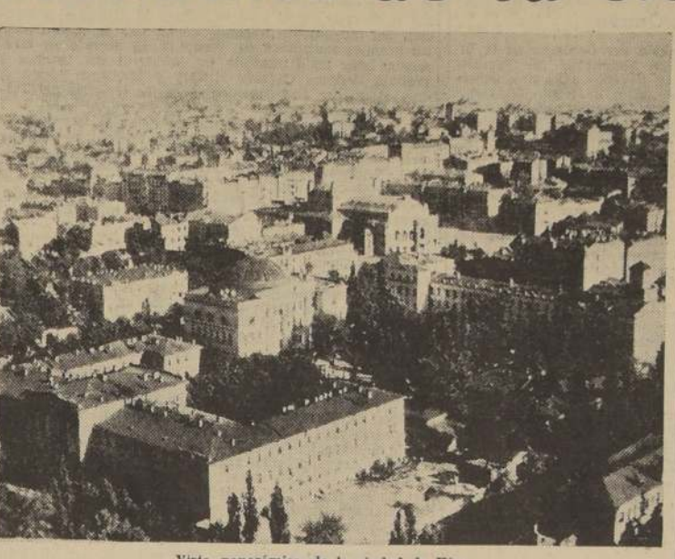
Vista panorámica de la ciudad de Kiev