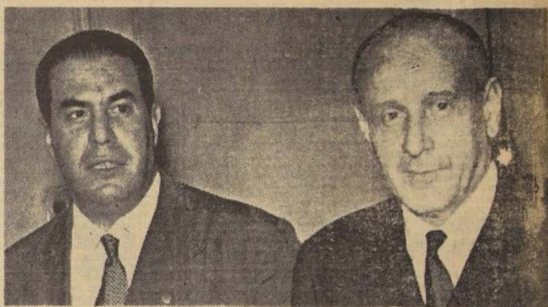
Ayer volvió al Congreso, pero convertido en Ministro del Interior, el ex diputado agrario laborista por el Primer Distrito de Santiago, don Sergio Recabarren Valenzuela. Cambió impresiones con los Comités Parlamentarios de la Cámara, sobre el despacho de cuatro proyectos de ley, antes del 27 de enero, y en seguida celebró la foto, una cordial entrevista con el presidente del Senado, don Fernando Alessandri. Después de esa fecha, el Congreso saldrá de vacaciones hasta el mes de marzo.