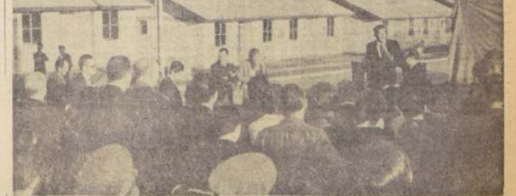
Un paso de positivo progreso para Los Angeles y para la solución del problema habitacional, representó la inauguración de la población "Andina", que consta de 56 casas. La construcción de esa población fue financiada con un aporte de la Cooperativa Andina Limitada y la Asociación de Ahorro y Prestamos del Laja. EN EL GRABADO, un aspecto del acto inaugural.

De esta forma, dijo el Gobernador, en declaraciones formuladas a LA NACION, se ha dado solución al grave problema que afectaba a la mayoría de las reparticiones públicas de Nacimiento, que debían funcionar en inmuebles totalmente inadecuados por los desgastes de los años, como asimismo, muy peligrosos para la integridad física de los empleados y del público en general.