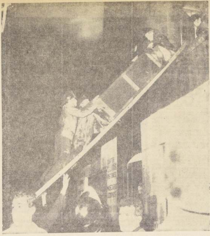
ESCENAS DE VERDADERO dramatismo se produjeron ayer tarde entre los habitantes del inmueble de Diez de Julio N° 1121, cuando tomó cuerpo el incendio y arrasó con el edificio habitado por más de noventa modestas familias. En el grabado se aprecian los desesperados esfuerzos de los bomberos, que resultan poco menos que impotentes para detener la acción de las llamas y salvar parte de los enseres.