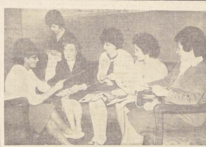
VALPARAISO. — CURSOS EN ADUANA. Con gran éxito se están realizando en el Departamento de Bienestar de la Aduana, en Valparaíso, cursos para los familiares del personal, que incluyen lección, economía doméstica, juguetería, etc. En el grabado, un grupo de asistentes a estos cursos que proporcionan útiles conocimientos y a los que asiste un elevado número de interesados.