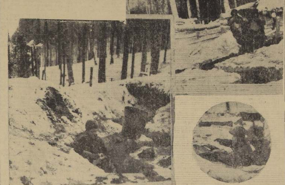
En las trincheras se entregan a la lectura de la prensa.