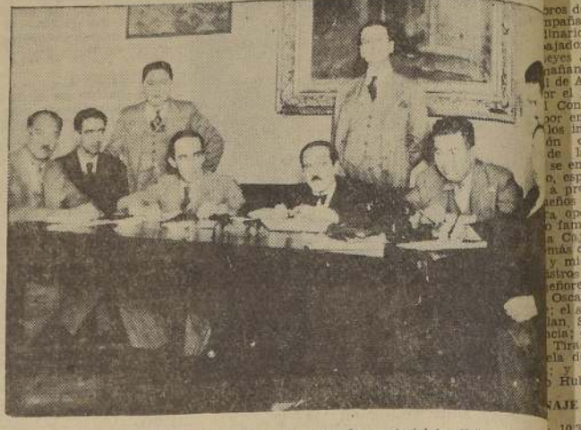
El comando general de la campaña senatorial frentista

COMITE DE EMPLEADOS FRENTISTAS Se ha constituido el Comité de Empleados Públicos y Particulares Frentistas para trabajar por la candidatura a Se-