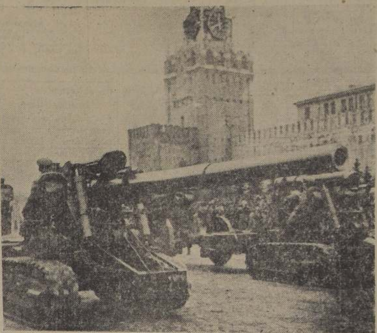
El ejército ruso cuenta con una eficiente artillería motorizada en la cual cifra gran parte de su confianza. Aquí vemos algunas de sus unidades durante un desfile en la Plaza Roja de Moscú.