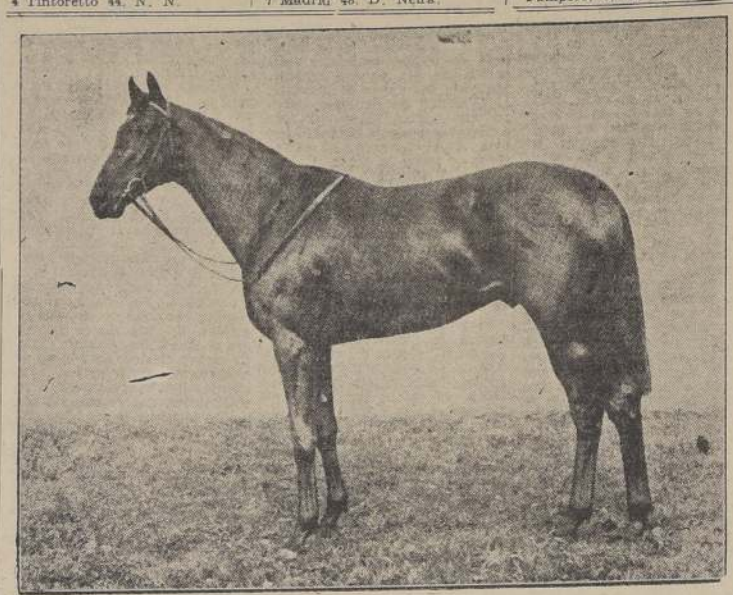
Scottish Union, que ayer en el Derby, lo mismo que en las Dos Mil Guineas, obtuvo el 2.º lugar.