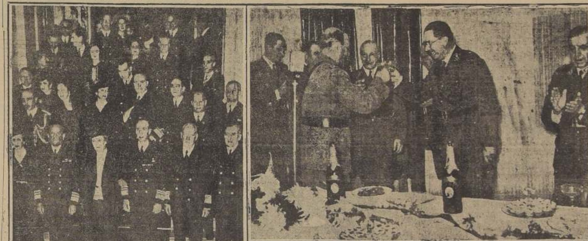
El Ministro de Marina, el almirante don Olegario Reyes del Río y otras personas en el Centro Naval

Asistieron los altos je- fes de las fuerzas ar- madas chilenas y ar- gentinas