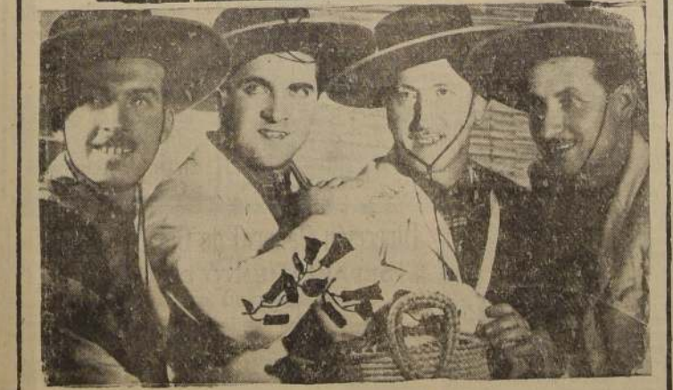
Cuatro muchachos — Cuatro voces — Cuatro guitarras