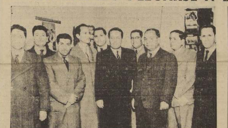
La directiva de la Sociedad Unión de Empleados del Hospital de San Vicente, durante su visita a LA NACION.