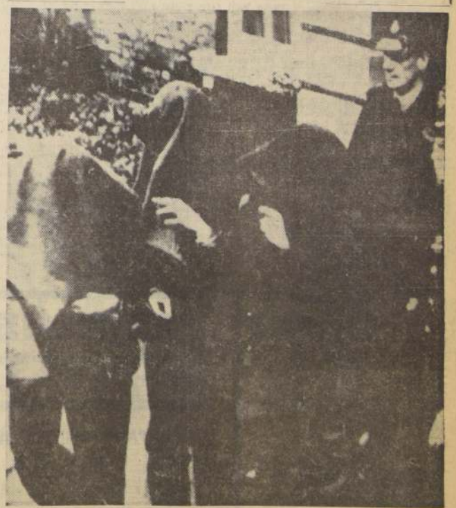
AYLESBURY, Inglaterra.— Tres presuntos integrantes de la banda que asaltó y robó a un tren postal, cerca de Londres, abandonan un tribunal local cubiertos con mantas. Seand Yard, que para un éxito más seguro pidiera colaboración de la INTERPOL, está convencido que la difícil madeja del caso se resolverá en breve. El robo, perpetrado por unos 30 individuos, significó un botín aproximado a los 2 y medio millones de libras.