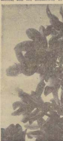
Una mosca llamada "sudafricana", la Ceratitis capitata, que ataca a los frutales de cáscara blanda, fue captada depositando sus huevos en una guayaba, en Pica. El fruto...

Entre 20 a 30 grados, que encuentra en Pica, y una humedad relativa en el ambiente. Esta última no existe aquí. Por eso es muy fácil extender la epidemia con insecticidas, afirma el señor Medina. La mejor barrera, para impedir la propagación de la mosca, son los kilómetros de desierto, que rodean a Pica.