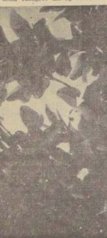
—en el centro del grabado—, que empieza a madurar, toma un color amarillento, que lo destaca del follaje.—

La botella está cerrada con un género que sirve de tapa. Impide a la mosca atravesar el envase.