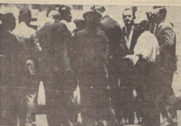
MIAMI, Florida.— El ex Presidente de Venezuela, Marcos Pérez Jiménez (a la izquierda, de camisa blanca) espera el momento de subir al avión que lo conducirá repatriado a su país. Junto a él, resguardándolo, funcionarios de seguridad venezolanos y norteamericanos.

CARACAS, 16 (UPD).— (Por James Whelan).— El ex Presidente de Venezuela Marcos Pérez Jiménez descendió hoy al anochecer en la mayor base aérea del país, y de inmediato emprendió el viaje hacia la prisión de San Juan de Los Morros, donde deberá esperar la iniciación de su proceso, acusado de haber despojado a la Hacienda Pública del equivalente a trece millones y medio de dólares.