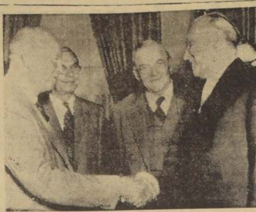
WASHINGTON. — El Presidente Eisenhower (a la izquierda) y el Canciller de Alemania Occidental, Konrad Adenauer (derecha), al reunirse con los Ministros de Relaciones Exteriores de Occidente en Nueva York y con el Primer Ministro británico, Sir Anthony Eden, en Londres.

Los demócratas sostuvieron al principio que también los proteccionistas aprobados originalmente por el Senado y aceptados por el Gobierno bien pudieran poner fin al programa de comercio liberal, iniciado por ellos en 1934.