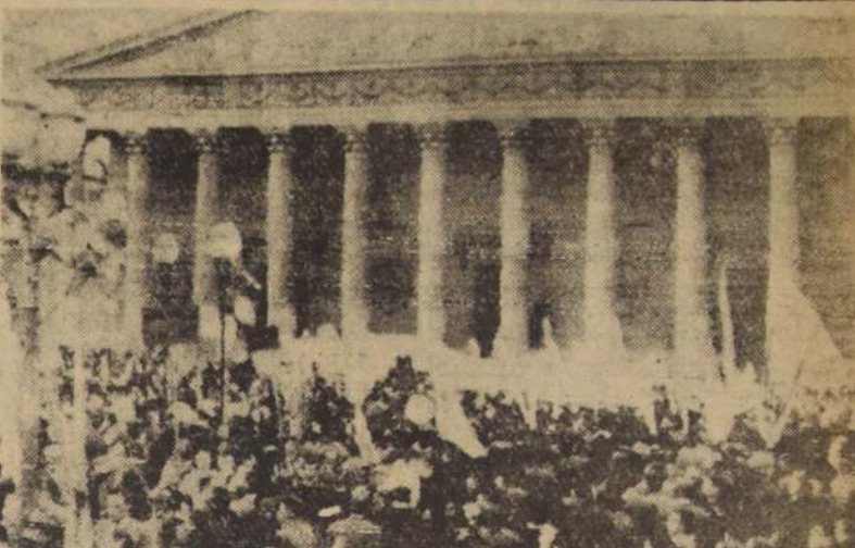
BUENOS AIRES — Una muchedumbre de peronistas, que defila, con banderas, en apoyo del Presidente de la República, para frenar a los agentes de policía, para resguardar el orden. La Catedral ha sido clausurada.

EL CAIRO, 14 (U. P.) — El Ministro de Chile, Fernando Orrego, manifestó hoy que el Primer Ministro Abdel Nasser, le ha expresado su deseo de visitar Sudamérica, porque para él las repúblicas latinoamericanas son modelos de desarrollo político-social.