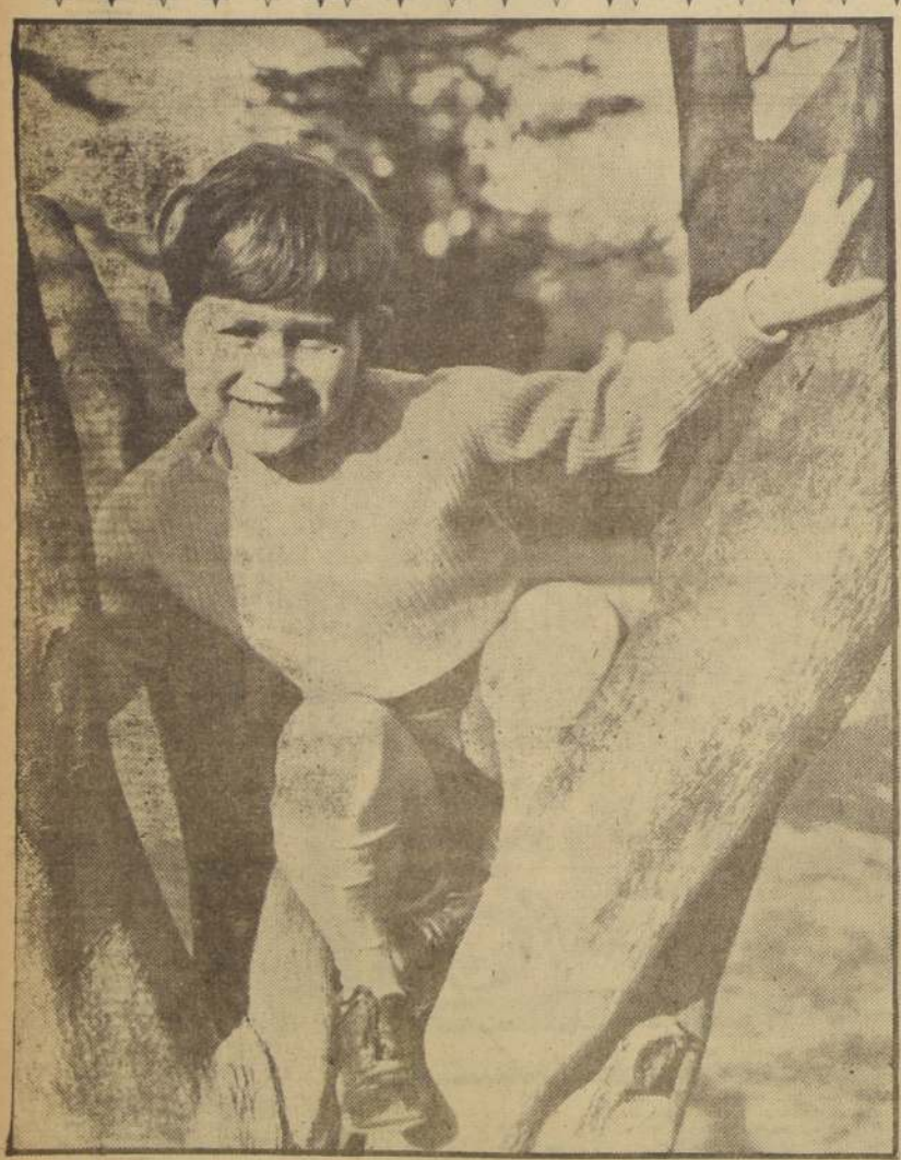
REALIDAD ENCARAMADA.—WINDSOR, (Inglaterra).—Encaramado en un árbol, en los jardines de la mansión real en Windsor, Inglaterra, el Príncipe Carlos, posa sonriente para el último retrato real.