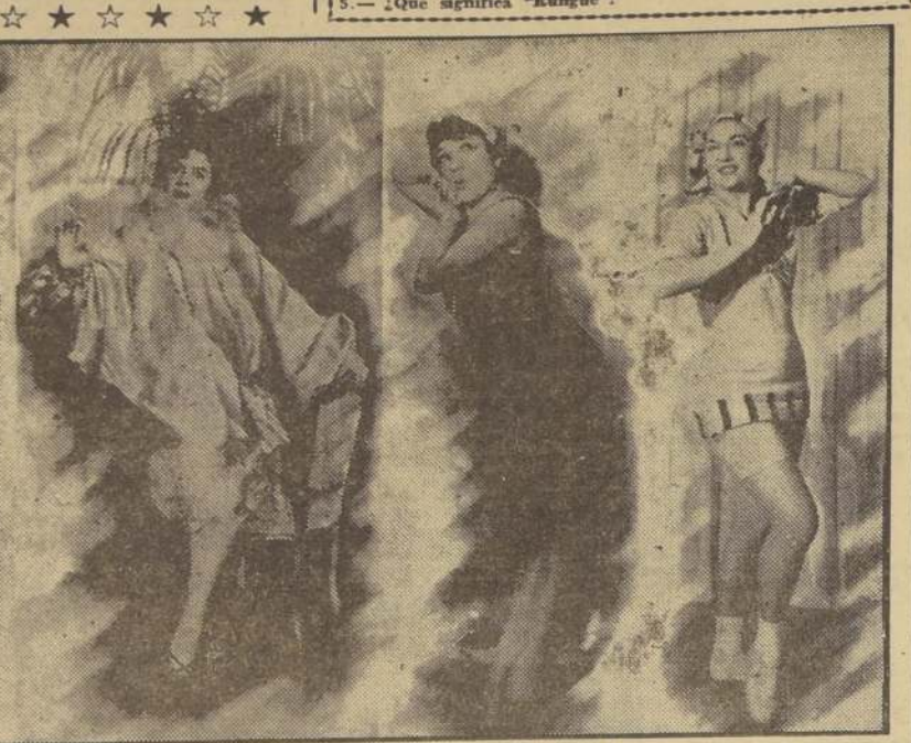
CUATRO PIMPOLLOS bailan el Charleston. La misma danza que tuvieron por el año 20 de moda nuestros padres. Pero ahora tiene para nosotros mejores atractivos, porque los tiempos no son tan recatados como los de la juventud Dorada. 20 no, dice usted lector? Para desmentir a papá y mamá, les presentamos esta muestra. Creemos que papá estará de acuerdo con nosotros... pero, siempre que no lo sepa mamá. Si usted quiere ver estos pimpollos en acción, le aconsejamos no se pierda "Al son del charleston", que las muestra junto con otras iguales a ella.