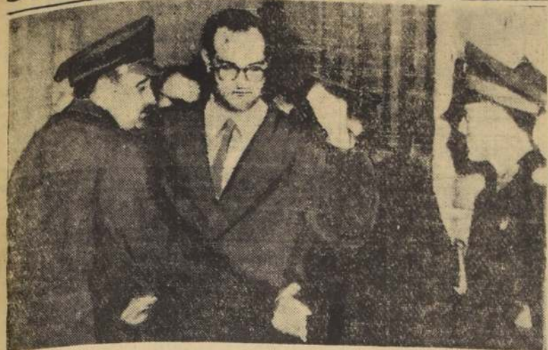
BUENOS AIRES — La policía registra a uno de los fieles que se refugiaron en la Catedral Metropolitana, a raíz de los disturbios de fin de semana, en los cuales fueron arrestados entre 450 y 600 personas, en cumplimiento de

órdenes impartidas por el Presidente Perón. Como consecuencia de los choques producidos entre grupos católicos y peronistas, resultaron heridas unas 25 personas.