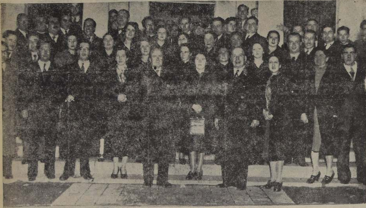
Asistentes al Vermouth ofrecido por la Rectoría del Liceo de San Bernardo con motivo del 27.º aniversario del establecimiento

El viernes, a las 16 horas, se llevó a efecto en el Teatro Municipal de la vecina ciudad de San Bernardo, una velada artística, con la que el Liceo de Hombres celebró el 27.º aniversario de su fundación.