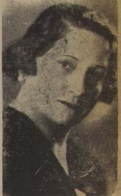
su distinción, su bondad y su belleza. Su hogar era un modelo de altas virtudes, de cordialidad castellana, de ternura y cooperación. Su casa era como un espejo de esos tradicionales hogares chilenos, donde reinaba una cordialidad fortificante.