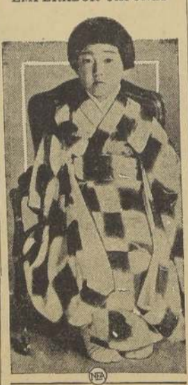
El día en que cumplía cuatro años, se sacó esta fotografía de la Princesita Teru, hija mayor de los Emperadores del Japon.