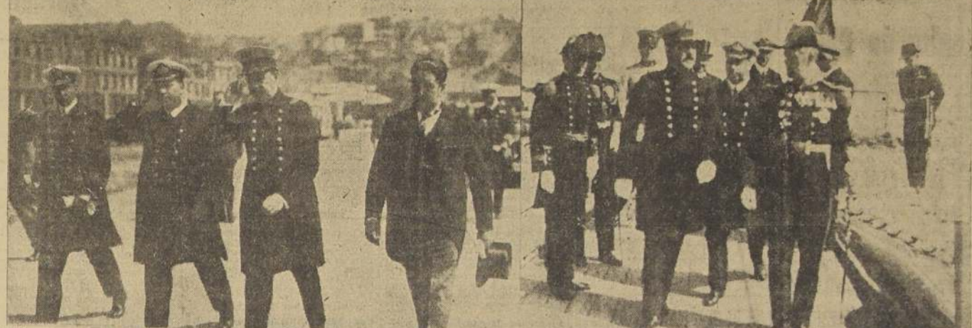
El Presidente de la República con el Ministro de Marina, Intendente de la Provincia y Jefe del Apostadero Naval después de efectuada la visita

AVISE USTED EN LA ESTACION RADIOTELEFONICA DE "LA NACION" HAY MAS DE 100.000 AUDITORES QUE LA ESCUCHAN DIARIAMENTE. HOY SE EXHIBEN ACTUALIDADES "LA NACION" EDITADAS POR ANDRES FILM. N.º 162 TEATRO OLIMPO (VISA). N.º 161 TEATRO ESMERALDA (LIMACHE).