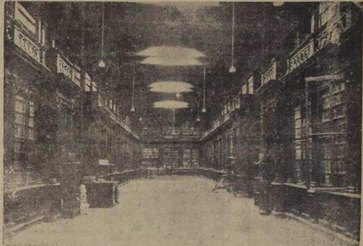
Una de las salas de la Biblioteca Nacional de Lima

PERDIDOS MAS DE 100.000 VOLUMENES Y MAS DE 40.000 MANUSCRITOS DE INAPRECiable VALOR