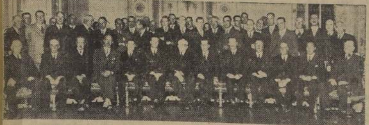
Asistentes al banquete de ayer en el Club de la Unión, en honor del presidente de la Sociedad Nacional de Agricultura

LA MANIFESTACION SE REALIZO EN EL CLUB DE LA UNION, CON UNA ASISTENCIA SUPERIOR A 300 PERSONAS.—COOPERATIVAS AGRICOLAS Y LECHERAS SE HICIERON REPRESENTAR EN ELLA — LOS DISCURSOS