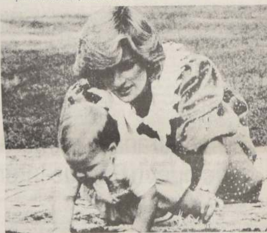
La princesa Diana posa para los reporteros gráficos australianos con su hijo Guillermo. La pareja real inglesa y su progenitor han causado admiración entre los súbditos de Australia, país al que visitan desde hace un mes.

Por otra parte, "Diario 16" da cuenta de que ayer las fuerzas británicas con base en Gibraltar, realizaron unos ejercicios técnicos de defensa, incluyendo acciones en helicópteros y buceadores en la cara sur de la roca, que observadores españoles consideran no son habituales.