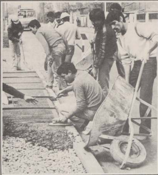
Se planteó como meta hacer 24 mil metros cuadrados de aceras. Ellos fueron y construyeron 26.400 sin gastar un peso de más. Ahora, la Municipalidad ha pedido plazas para otros tres mil trabajadores, porque ellos han probado que, disponiendo de los medios, pueden sacar adelante su comuna.

Como paliativo, aun cuando no es la solución definitiva, se pensó en estos