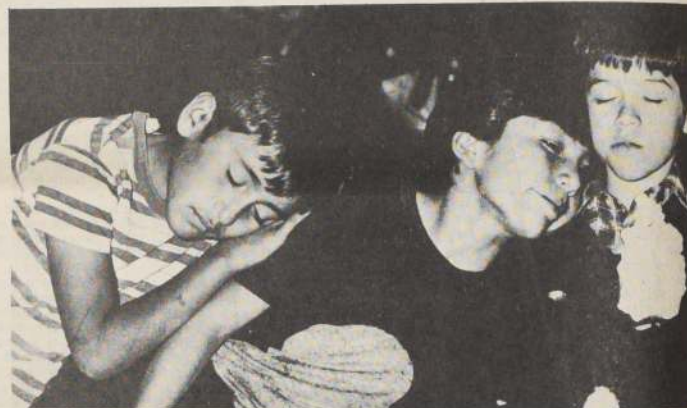
Los actores infantiles de la Escuela Popular de Arte Escénico de Quinta Normal han recibido elogiosos comentarios de la crítica y el público en sus anteriores presentaciones.

La comedia musical relata, por una parte, el drama de una mujer que llega a la Vega Central buscando a su hijo, a quien perdió recién nacido y al cual, presumiblemente, habría robado una mu-