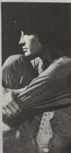
Emmanuel no quiso confesar su matrimonio cuando vino en febrero al Festival de Viña del Mar, pero para esa fecha ya estaba casado. Al parecer, prefiere que no se metan en su vida privada.

Entre las canciones que trae este LP que llega a Chile en los próximos días figuran "Tengo", "El año que vendrá", "Estoy loco", "Pertenezco a tí", "El Rey Azul", "Sólo voy" y otras, todas con letras de Emmanuel.