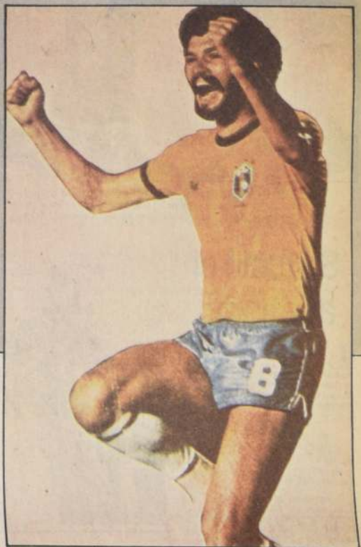
Sócrates, jugador básico de Brasil. — A Chile le corresponderá tratar de anularlo con una marcación personal. El brasileño fue ratificado por Carlos Alberto Parreira.