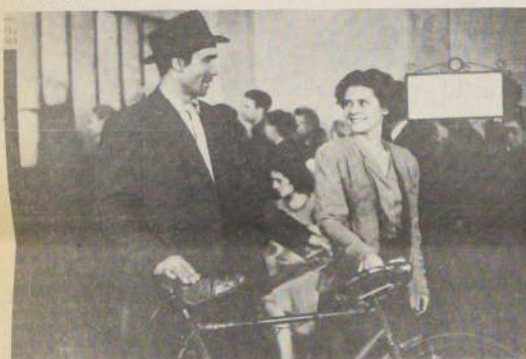
Lamberto Maggiorani fue descubierto por De Sica para que protagonizara su filme "Ladrón de Bicicletas", pero el éxito que alcanzó por su actuación en esa película nunca pudo igualarlo con otras.

Más tarde la hechicera predice a Ricardo que morirá a manos de un amigo, el primero que le estreche la diestra. Los presentes se ríen de la anciana, pero nadie se atreve a darle la mano. El conjuro está dado y el destino paso a paso será inexorable.