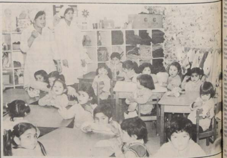
Los auxiliares de párvulos enseñan a los niños durante el día, una serie de actividades que tienden a su desarrollo integral.

El médico explica que su principal preocupación preventiva es detectar a los menores algún grado de desnutrición, los cuales, aparte de las tres comidas, se les otorga una colación consistente en productos de fácil digestión. Esta acción, según el médico, permite recuperar a los