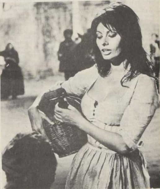
Sofía Loren, protagonista de la película "Mortadela" en Función de Gala de Canal 11.