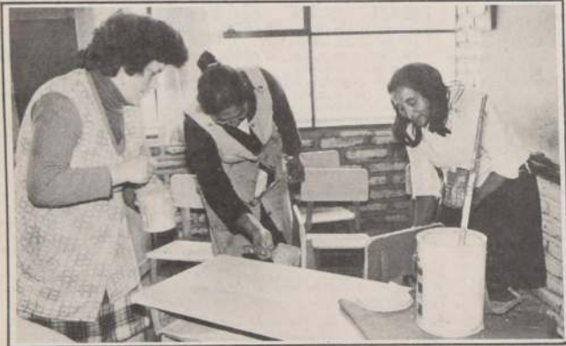
Las mujeres no se quedan atrás cuando se trata de trabajar. La construcción y reparación de mobiliario escolar y de ropas para emergencias corren por cuenta de ellas.