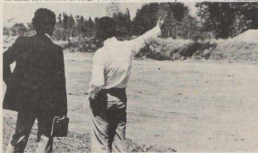
El público podrá hacer deporte y descansar en medio de un hermoso paisaje precordillerano en el Parque Intercomunal.

Las nuevas viviendas donde fueron trasladadas las 327 familias quedan ubicadas en el área ex-Parque Industrial de la comuna de Pudahuel.