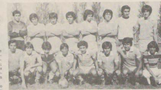
CON JUVENILES. CHIPRODAL, de Graneros, ha integrado algunos juveniles en el torneo de la Cuarta División. Una buena oportunidad para estos nuevos valores del fútbol amateur que juegan hoy en Cerrillos con LAN-Chile.