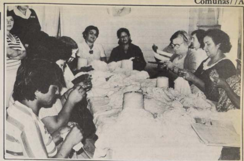
En plena faena, las integrantes del Centro Laboral "Las Arañitas" de la Unidad Vecinal 24, dan forma a diversos tejidos que posteriormente se venderán en los bazares de CEMA Chile.