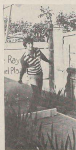
RAYUELA. Hoy prosigue el torneo oficial de Rayuela de la Asociación de La Cisterna.

Los puntajes oficiales, cumplida la cuarta fecha, son los siguientes: CHILECRA, METALÚRGICO FARO y LAN-CHILE, con siete puntos cada uno; Deportivo Gasco y Malloco Atlético, con seis; Soñaca-Bata, Municipal de Las Condes, Barnechea y Unión Veterana, con cuatro; Andarivel, Unión Cepol, Chiprodal y Thomas Bata, con tres; Arrieta Guindos y Comercio, con dos, y Granja Juniors, de Puente Alto, sin puntos.