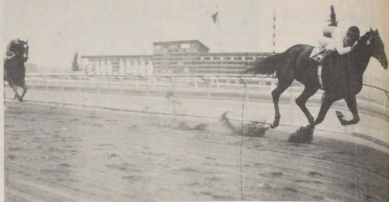
TAPADITA: Saco cuatro cuerpos a Mocita Ebría, en la mejor presentación de su campaña pistera. La pupila de Raúl Serrano pagó a ganador un dividendo de $ 7.10.

Canadá por 5 1/2 cpos. el 3º a 1 1/4 cpo. el 4º a pzo. el 5º a 1/2 cpo. y el 6º a 1 cpo. Tpo. 1.13 4/5 No corrió (11) P.Mi Solo. Prep. Oscar Espinoza Div. $ 7.80, 2.90, 2.60, 5.60