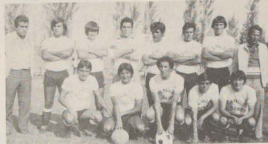
MALLOCO, el nuevo astro del torneo de la Cuarta División se está mostrando bien y ya está de escolta de los punteros con seis puntos. Juegan en su cancha con Comercio de Buin.

□ Tres invictos: LAN-Chile, Metalúrgico Faro y Chilecra, juegan en la quinta fecha