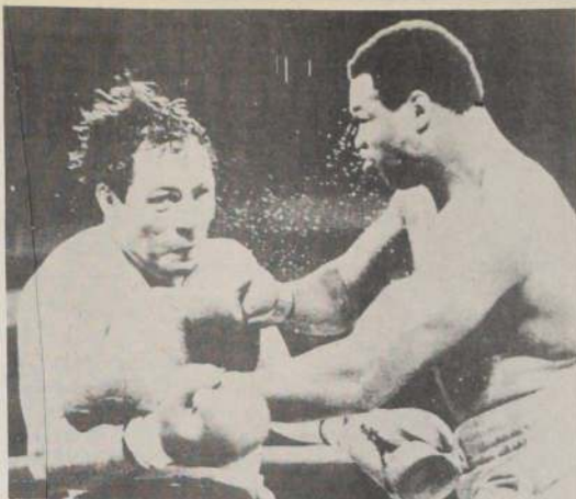
LARRY HOLMES, le dirá adiós al ring en la presente temporada. En la fotografía, en la última defensa de su corona cuando derrotó al francés Lucien Rodriguez.