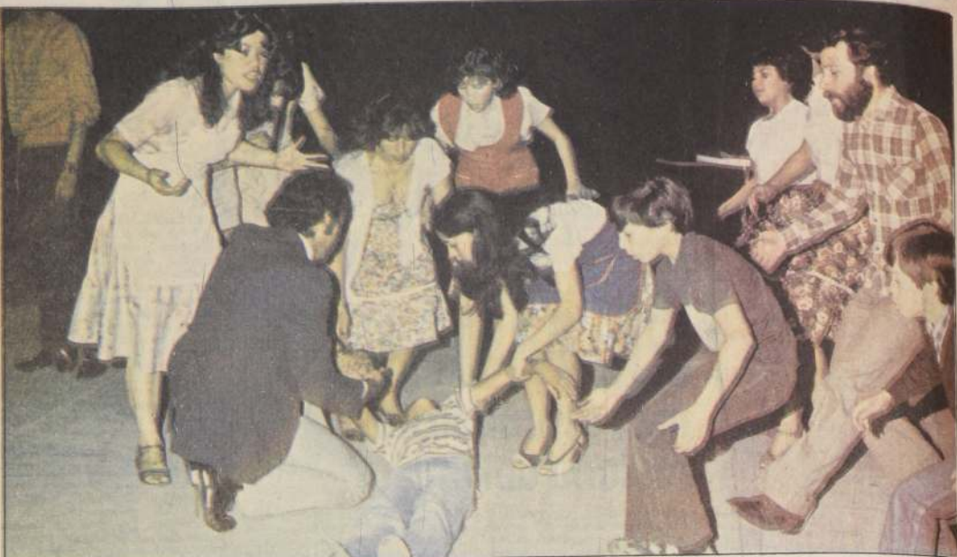
Las penas y alegrías de "pelusitas", veginos, locatarios y otros típicos personajes de la Vega Central, mostrará la comedia musical que

se ofrece mañana lunes y el martes a las 19 horas en el Casino Las Vegas.