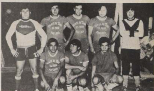
DE MALLOCO SON LOS CAMPEONES del Deportivo El Paso. Son los reyes de baby fútbol y siguen invictos en todas las localidades vecinas. Han ganado en Peñaflor y Talagante y ahora son punteros e invictos en Malloco con los hermanos Urbina, Fuentes, Gómez, Jara y Abarca.

Entre los equipos presentes en la confrontación —que comprende las categorías de hasta 10 y 14 años—, destacan los del Colegio Craighouse y Club Manquehue de Santiago y el Sporting de Viña del Mar.