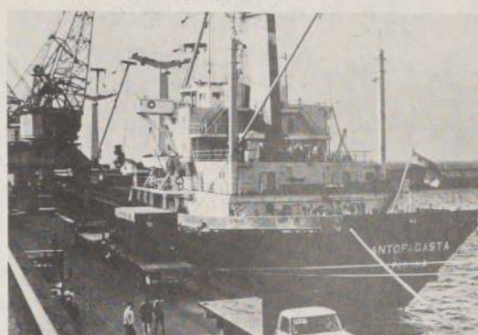
La Dirección de Promoción de Exportaciones impulsa los envíos al exterior de nuevos productos chilenos.

El estudio también compara la actuación de EUA en las últimas dos categorías —subsidios a la producción y fomento a la exportación— con las de otros países industriales.