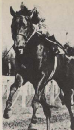
LAUTARO , tres años por Balconaje y La Cibele por Forest Row, que ha progresado bastante en su training, afrontará un serio compromiso en los 2.000 metros del clásico reglamentario, premio Carabineros de Chile, que se correrá esta tarde en el Club Hípico. (En el grabado, por última línea).