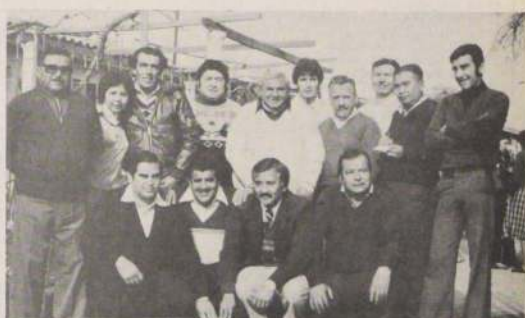
CLUB "CINCO Y MEDIO". VIEJOS TERCIOS que suman 634 años. Son los invictos del campeonato de baby fútbol de viejos tercios en la Villa Olímpica, torneo "Armando Avendaño". A su último rival, el club Carlos González, lo ganaron 14-9.