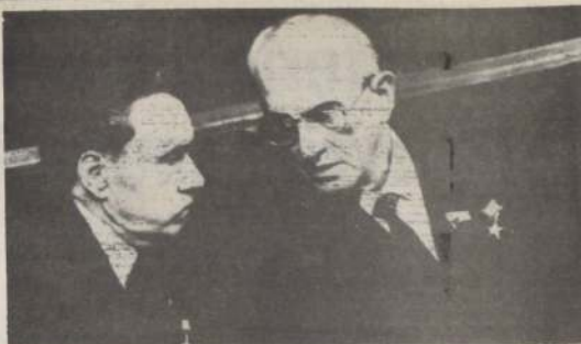
El Presidente de la URSS, Yuri Andropov, derecha, quien dialoga en el Kremlin con el Canciller Andrei Gromyko, realizó duras críticas contra la postura armamentista de Estados Unidos, en una entrevista concedida al semanario alemán "Der Spiegel".

Los documentos que mantuvo Hitler durante los 12 años de su dictadura podrían significar que la historia de la Segunda Guerra Mundial debería ser reescrita.