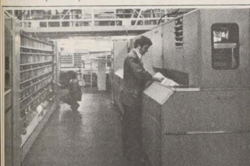
Una cada vez menor acción proteccionista se observa en la industria de Estados Unidos, de acuerdo a lo revelado por los últimos informes.

Consultado posteriormente sobre los alcances obtenidos durante estos dos años, Rabat señaló que en la actualidad los suscriptores han alcanzado casi la capacidad de la planta que es de 5.000 líneas, ya que ellos suman un total de 4.700 personas que reciben los servicios.