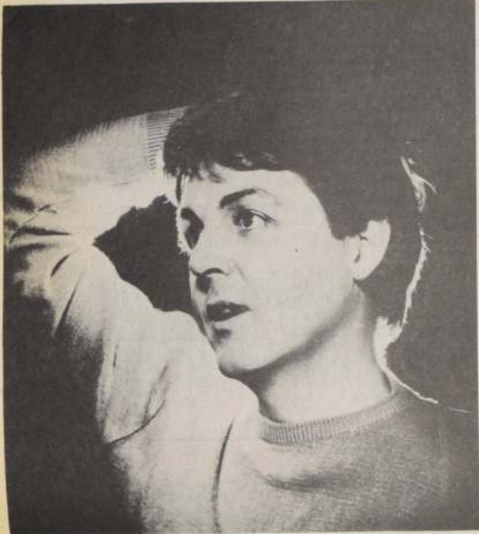
Paul McCartney, mientras tanto, deberá desembolsar mensualmente la suma de 282 dólares.