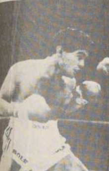
SANTOS "Falucho" Laciar defenderá en Tokio, ante el retador japonés Hozumi, una vez más su corona mundial de la categoría mosca.

El segundo preclasificado en el torneo será el estadounidense John McEnroe, seguido por el argentino Guillermo Vilas, el sueco Mats Wilander, el también argentino José Luis Clerc, el español José Higueras, el norteamericano Vitas Gerulaitis, el australiano Peter McNamara, el francés Yannick Noah y el norteamericano Elliot Teltscher.