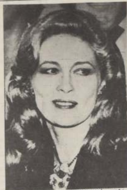
Faye Dunaway aparecerá protagonizando los filmes "Duet for one" y "The Wicked Lady".