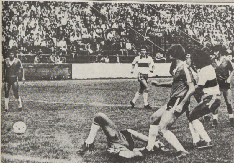
UNIVERSIDAD CATOLICA juega ante Cobreloa, mientras que Magallanes, en San Bernardo, recibe a Deportes Arica.

Maradona expresó que "Menotti trató de lograr un equilibrio entre la furia y el tratamiento de pelota; de todos modos siempre recuerdo lo que dice Quini (compañero de Maradona); el "Barza" es un equipo con mucha mala suerte".