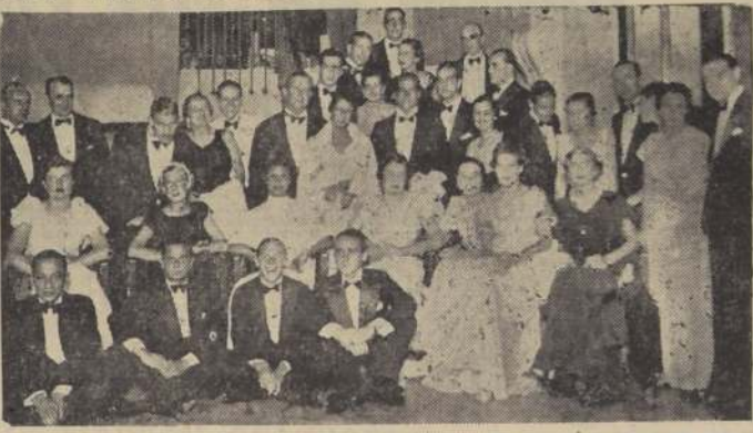
Asistentes a una de las últimas comidas en el Cabaret del Casino de Viña del Mar.