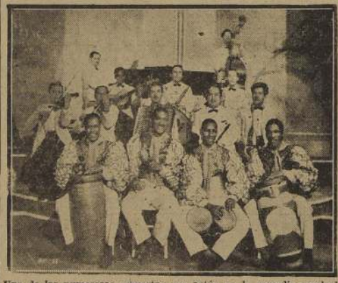
Una de las numerosas orquestas que actúa en la comedia musical "Besame mucho"

Por primera vez se reúne un gran repertorio de figuras cómicas en una comedia musical. Y esto sucede en la película "Besame mucho", cuyo tema ha sido tomado del popular bolero que puso de moda en nuestro país Pedro Vargas.