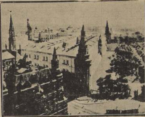
El Kremlin de Moscú visto desde sus célebres jardines

PLATA COMPRO Pesos 1921 al 1927 y pesos de 1932, dardillas y chuchucas, dieces y cinco de los de agua, y toda clase de monedas antiguas de plata. Únicamente pago al contado. HUERFANOS N.º 1121 Teléfono 86747