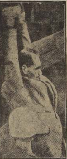
Primera fotografía de Rudolf Hess en el momento de incorporarse de un salto en la dramática audiencia del 30 de noviembre último, gritando: "Mi memoria vuelve a estar bien otra vez. Mi amnesia fué táctica"

COMPRO JOYAS BRILLANTES BOLETOS DE EMPENO DE ALTAJAS PAGO ALTOS PRECIOS FONO 86747 HUERFANOS 1121