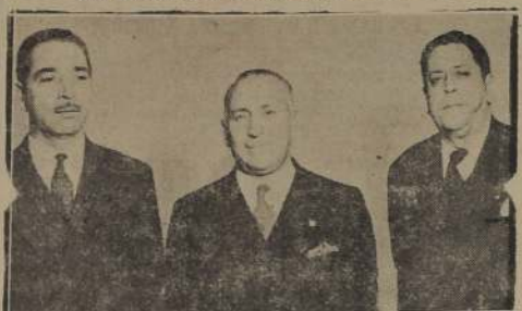
La comisión de las Fuerzas del Orden en Retiro, durante su visita a LA NACION.

LE SOLICITARON AUMENTO DE SUS PENSIONES, LAS CUALES SON LAS UNICAS QUE NO SE HAN MEJORADO ENTRE LOS SERVIDORES PUBLICOS