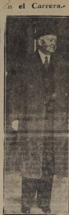
Señor Hebert Hoover, ex Presidente de los Estados Unidos de Norte América, en el hall del primer piso del Hotel Carrera.