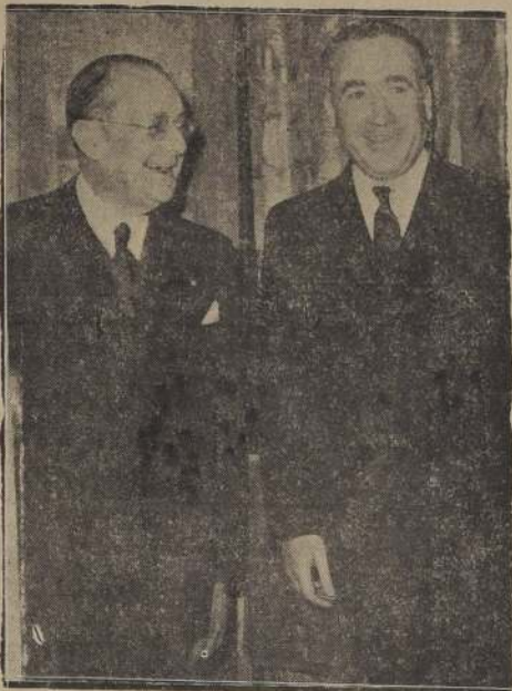
El Embajador Bianchi creó recientemente una comisi6n entera con el presidente del Consejo de Ministros del Gobierno Republicano español, señor José Giral