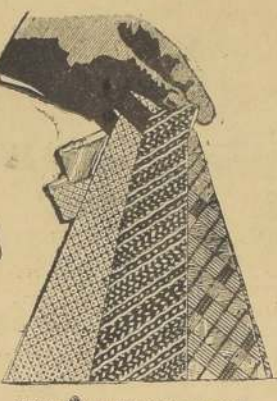
CORBAZ Colmarín de seda fantasía, selecciones de gran moda, antes 7.90; ahora, 3.50