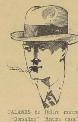
CALANES de fieltro marca "Borsalino" (Antica casa), gran saldo de medidas; antes 79.50, ahora 55.-