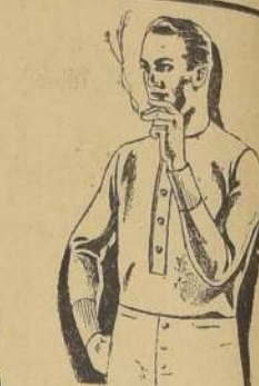
CAMISETAS o Calzoncillos de lana, tejido grueso, marca "Wolsey"; antes 52.50, ahora 39.50