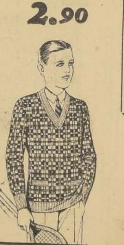
PULL OVERS de pura lana, dibujos de última moda, artículo inglés "Wolsey" para años 7 a 16; antes 49.50, ahora 35.-