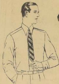
CAMISAS madapolán fino, con puños dobles, sin cuello, 12.90

Aproveche ahora que los PRECIOS ESTAN REBAJADOS AL MAXIMO