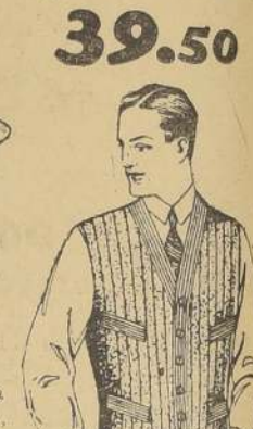
CHALECOS de punto, sin mangas, gran variedad de dibujos; antes 62.50, ahora 39.50