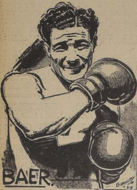
Max Baer, el payaso del ring, que jamás ha tomado en serio el entrenamiento

Pues bien; Jimmy se entrenó a conciencia, eliminó esas 21 libras de excedente en poco tiempo.