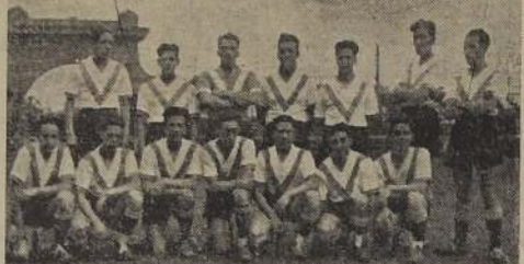
Equipo del Real Santiago, que ha enfrentado a los mejores de la competencia teatral, y que espera colocarse bien

En la tarde del sábado último, se realizó el match entre los elencos del Teatro Metro e Ideal Selecta, correspondiente a la primera rueda de la competencia Teatral de Football de Santiago, cuyo principal estímulo es el trofeo Metro Goldwyn Mayer.