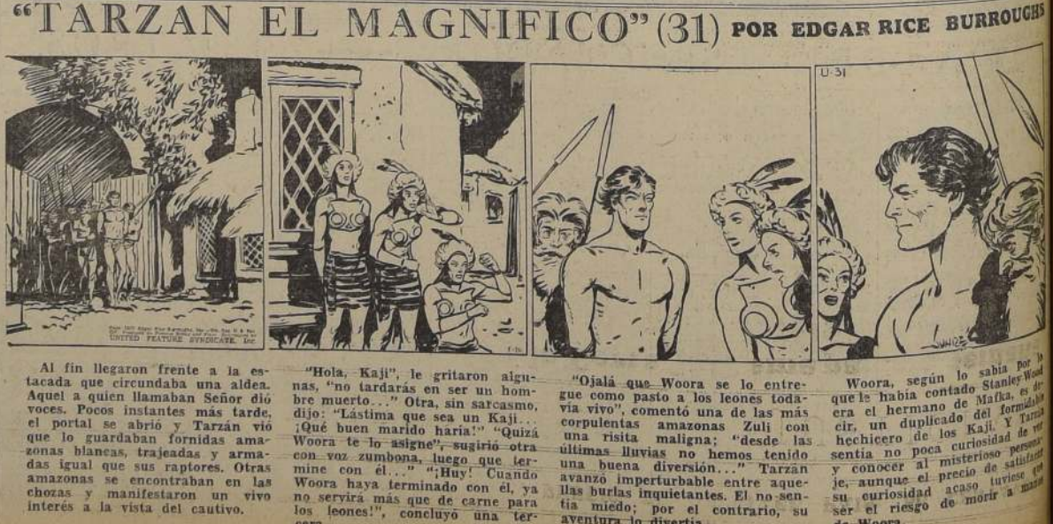
"TARZAN EL MAGNIFICO" (31) POR EDGAR RICE BURROUGHS

Woorra, según lo sabía por lo que le había contado Stanley Wood, el hermano del forajido, el cirujano de los Kaji y Yurka, hechicero de los Kaji, Yurka y Woorra, no tenía curiosidad por conocer el precio de su vida, aunque el precio de su vida era el riesgo de morir a manos de Woorra.