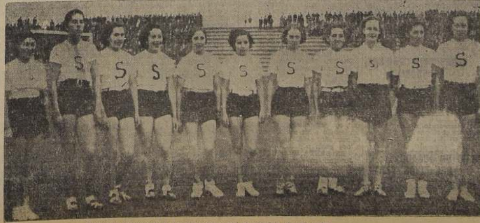
El equipo femenino de Santiago que ganó la estafeta de 10 x 100

Esta revista será el órgano oficial del olimpismo, a virtud de haberse combinado su publicación con la del "Bulletin Officiel" del Instituto Olímpico Internacional.