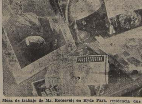
Mesa de trabajo de Mr. Roosevelt en Hyde Park, residencia que ayer fué visitada por el Presidente Ríos.