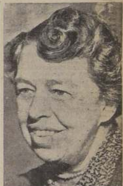
Mrs. Eleanor Roosevelt

El señor La-Guardia dijo que el nombre elegido para la avenida representaba la consolidación de las naciones del hemisferio occidental. Añadió que el nombre expresaba el amor del pueblo neoyorquino por las repúblicas hermanas. Recordó que el Presidente Roosevelt creó la política de buena vecindad. Añadió: "Dedicamos la Avenida de las Américas como símbolo de eterna amistad al pueblo de todo el Continente, como constante recuerdo de que el afecto en-