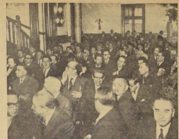
ASPECTO DE LA última sesión de la primera Asamblea Nacional del radicalismo.

Declamó unos inspirados versos dedicados al Partido. Fue —según todos—, "la pausa que refresca".