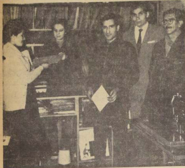
Vencedores de uno de los últimos Sorteos Semanales de la POLLA DEL MUNDIAL DE FUTBOL DE LA NACION. Retiran sus premios de Casa Radiolandia, San Antonio 750.