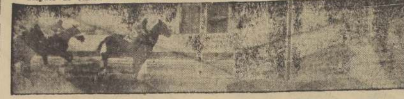
Quinta carrera: Lolol, Cáceres "up", gana la prueba principal de la reunión de la mañana, precediendo por cuerpo y medio a Lady Ada; El Clarín, tercero a una cabeza.