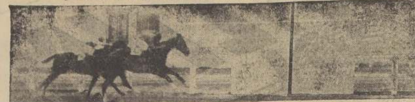
Sexta carrera: El favorito Cabimbaro es precedido por medio cuerpo por Chateau Latour; tercero Dakmó.

Se destacó al frente, perseguido muy de cerca por Cheneque, quedando a continuación Delatora, Polyaná y Cautina, mientras My Own cerraba la marcha, pues movió a la cola. Al llegar al pelotón a la curva, Cheneque pasó a la punta, poniendo 1 cuerpo sobre Peronella y Delatora, ventaja con que entró al derecho final, no tardando en retroceder Peronella. La pupila del Carmencita cayó sobre el líder a 150 metros para el disco, no demorando en pasar al frente, hasta llegar al disco con 1 y medio cuerpos sobre Polyaná, que al final la arrebató el segundo lugar a Cheneque por media cabeza. Cuarto finalizó Blamark y a continuación Cautina, Peronella y Vase d'Or. Último Mont d'Or. Tiempo: 58. No corrió Savole.