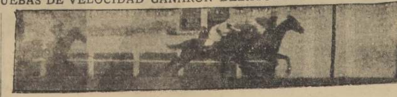
Primera carrera. — Alce, el propio hermano de Chamer, abandona, por fin, la categoría de perdedores, después de reñida lucha con Gravel, que llegó segundo; a tres cuerpos, Nímea.

El premio Liguria, handicap sobre 1,500 metros, se resolvió por el triunfo de Tremblay, que se impuso de punta a punta, y en donde estuvo por cuatro cuerpos a Rendida. Cuando el campo quedó libre, Tremblay lució sus colores al frente, seguido a tres cuerpos por Salpicado, Glider y Kabezón, que corrían casi en una línea, y quedando más atrás Rendida con Mala Nueva, en tanto que Polenka y Jacobine se iban a la cola. Con la sola variante del paso de Rendida al segundo puesto, en los 800 metros, en tanto que Salpicado retrocedía a los últimos lugares, enderezó el grupo al derecho de decisión. El hijo de Burgomaster, contenido en su acción, recorrió la recta en cómodo escape, llegando a la raya con cuatro cuerpos sobre Rendida, que precedió por poco a la Rendida, que a su vez se impuso al final. Cuarto Salpicado, quinto Kabezón y Sexta Mala Nueva. Último término Glider. Tiempo: 1:35 4/5. No corrió Alarmista.