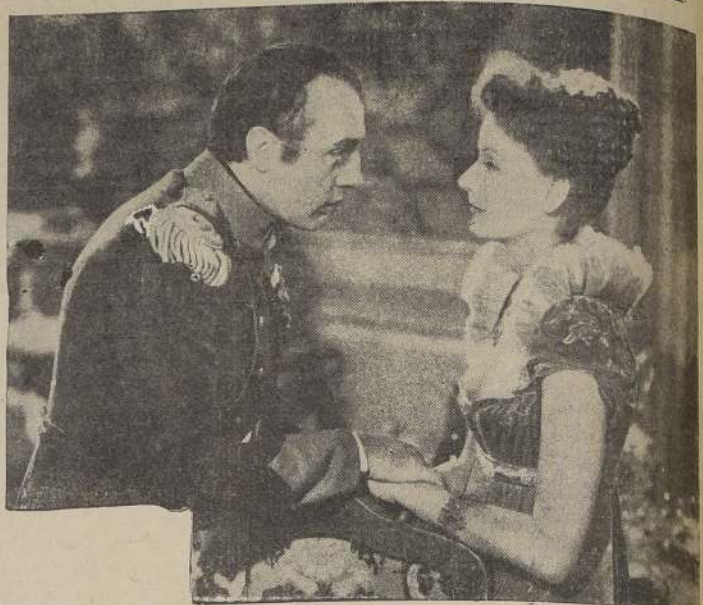
Charles Boyer (Napoleón) y Greta Garbo (Condesa María Walewska), en una escena de la película que ambos actores terminaron recientemente.