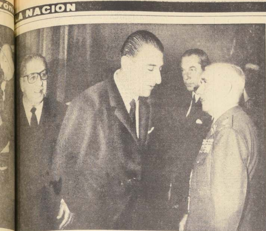
Con la visita a Sao Paulo ha culminado la extraordinaria gira que realiza al Brasil, el Presidente de la República, Eduardo Frei. La declaración conjunta dada a conocer y suscrita por los dos países, es la culminación del rotundo éxito que alcanzó la visita del Mandatario chileno a la República amiga. La cordial acogida que el pueblo brasileño tributó al Presidente ha sido considerada unánimemente como una de las más excepcionales que se hayan brindado a Jefes de Estado en ese país. En el grabado, el Presidente Frei durante uno de los muchos actos en que participó durante su gira.