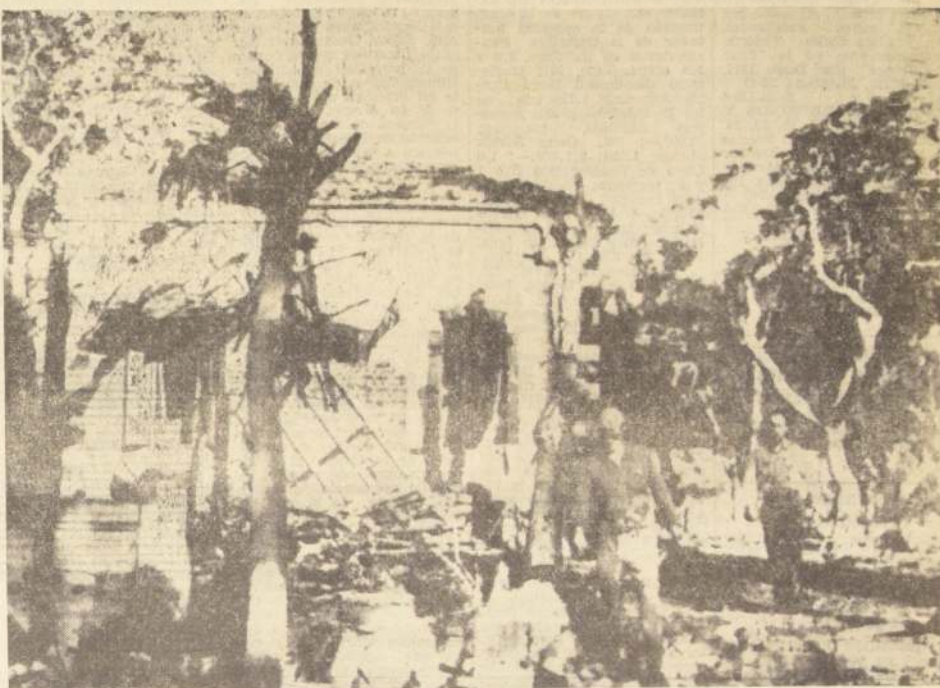
Un observador de la misión de tregua de las Naciones Unidas contempla melancólicamente las ruinas de su cuartel en Ismailia, en la zona del Canal de Suez, en poder de la RAU, tal como quedó después del violento duelo artillero entre egipcios e israelitas, ocurrido anteaer, (Radiofoto UPI)

Uno de los funcionarios que participaron en aquellas conversaciones, el Primer Ministro Oldrich Cernik, volvió hoy a la capital soviética, junto con otros líderes locales, para conferencias sobre "cuestiones económicas" con los rusos.