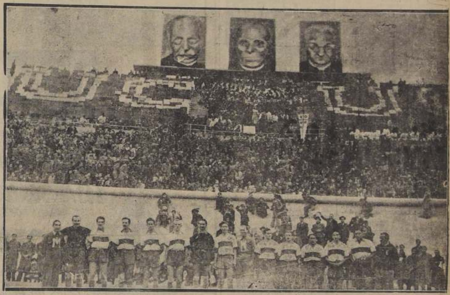
UNIVERSIDAD CATOLICA.—Fue muy valiosa su reacción del segundo tiempo, y por eso mereció el empate a 2. Vemos al equipo frente a su "barra", quien le presenta su emocionado y bullicioso saludo al incorporarse a la cancha.