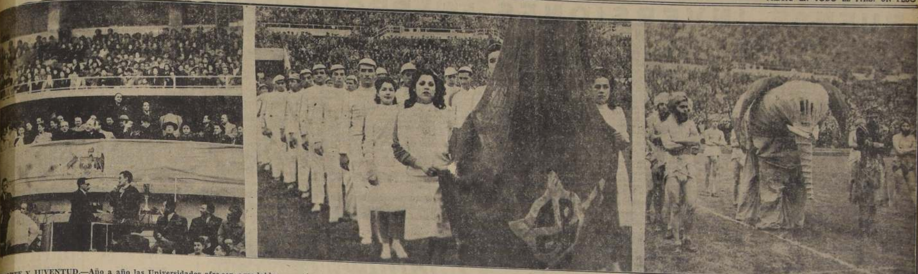
REPORTAJE Y JUVENTUD.—Año a año las Universidades ofrecen agradables espectáculos con motivo de su match oficial de fútbol por la competencia profesional. A la reunión de ayer asistieron 50 mil personas que pagaron $ 459.629.40. En el fondo, el Cardenal Monseñor José María Caro; el Canciller del Perú; el Embajador de Rusia; Ministros de Estado y altas personalidades presencian desde la tribuna oficial el desarrollo del festival. Al centro, una delegación de damas y varones de la Universidad de Chile portan el estandarte de su club deportivo. Finalmente, a la derecha, durante uno de los números locos que presentaron las "barras".