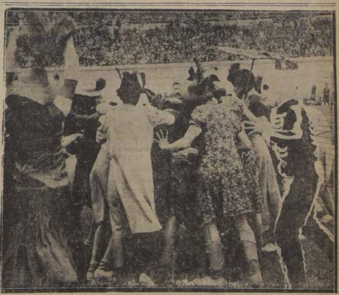
LOS "APUROS" DE JORGE NEGRETE.—Las pseudo damas, poco menos que linchan a Jorge Negrete. El "actor" llega vestido como charro mexicano y quedó como atleta... Fue este uno de los números locos que agradó.

EN EL PRIMER PERIODO IMPRESIONO MEJOR LA UNIVERSIDAD DE CHILE, PERO LUEGO EL ADVERSARIO REACCIONO EN TAL FORMA QUE MERECE UN EMPATE QUE HAY QUE ACEPTAR