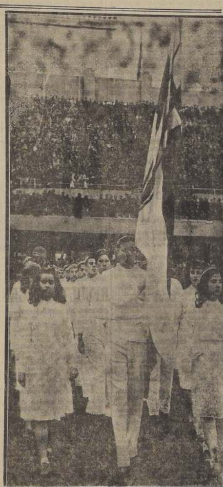
EL ABANDERADO. —Con su escolta de damas, el abanderado del Club Deportivo de la Universidad Católica se presenta al público. En el fútbol hubo empate, y también en las "barras".

El primer encuentro del campeonato, que se disputó en la cancha del Famae, a las 11.30 horas, fue el que enfrentó a la Universidad Católica con el equipo de Ferroviarios.