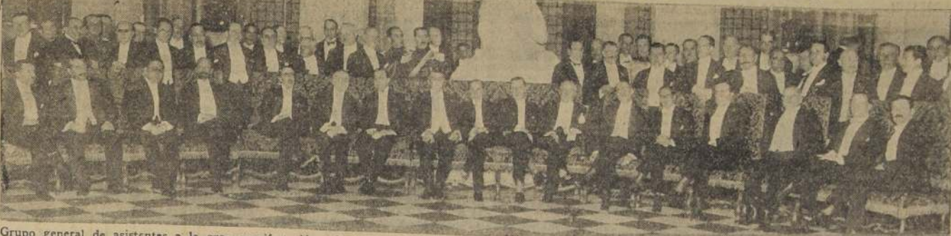
Grupo general de asistentes a la gran manifestación ofrecida por el Ministro de Relaciones Exteriores, señor Ríos Gallardo, en honor del Embajador de Estados Unidos, Excmo. señor Collier, con motivo del regreso a su patria

LA FELICIDAD.— LA FELICIDAD ES ESA CASA TAN ALEGRE, TAN BONITA, CUBIERTA DE FLORES. ES NECESARIO PARARSE AL FRENTE; SI USTEDES ENTRAN, NO LA VEN MAS.—ALPHONSE CARR.