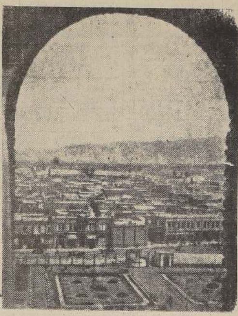
Panorama de Tabriz

"Se hace notar aquí que en el comunicado se declara que los británicos penetraron por cuatro puntos, pero el locutor citó los nombres de cinco poblaciones."