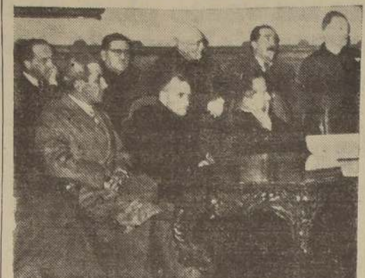
Personalidades que presidieron el acto de ayer en la Universidad Católica.

Al día siguiente, el "Rakuyo Maru" continuó viaje al puerto de Cerro Azul, distante 31 millas de Pisco y en donde se mantuvo también la incomunicación.