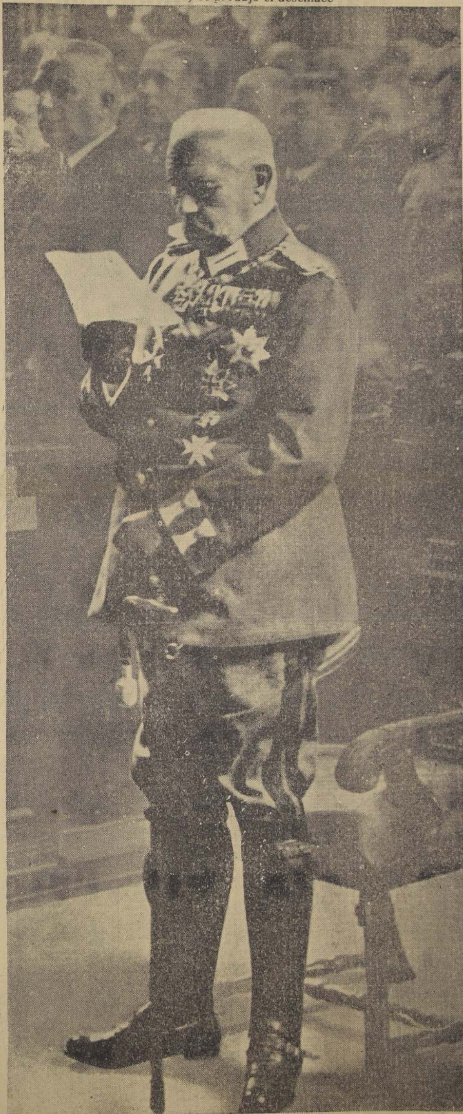
Mariscal Paul von Hindenburg