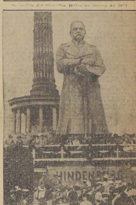
La inmensa estatua de madera, del jefe de los ejércitos, del tiempo de la guerra

En la pequeña aldea de Neudeck, un medio centenar de periodistas que había esperado en pie toda la noche, tuvo la primera noticia de la muerte, cuando la gran bandera dorada presidencial que flameaba desde los torreones del castillo fué arriada a media asta. Ya eran las 9.20. Simultáneamente la campana de la capilla del villorrio comenzó a tocar a difunto. Los campesinos que trabajaban en los campos y potreros vecinos, se descubrieron respetuosos y doblaron sobre el pecho sus cabezas en actitud de oración.