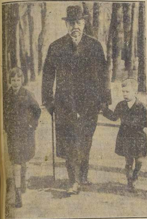
Von Hindenburg, amante de los niños, pasea con ellos.

BERLIN, 2. — Rodeado por su familia, el mariscal Paul von Hindenburg, Presidente de Alemania, murió a las 9 de la mañana. Cien millones de alemanes, sin distinción de credos políticos, lamentan su muerte, en la patria tanto como en el exterior. Los cables han vibrado durante todo el día desde grandes capitales del planeta, trayendo las condolencias de todas las latitudes.