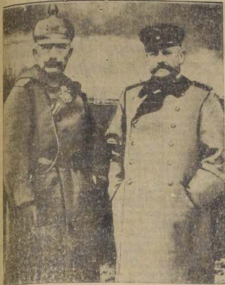
Con el ex Kaiser en el frente en 1915

Cien millones de alemanes, en todo el mundo, lloran el desaparecimiento de su héroe. — Jefes de Gobierno y estadistas envían sus condolencias al Reich. — A las 5.45 cayó en profundo sopor, y a las 9 (4 de la mañana, según hora de Chile) se produjo el desenlace