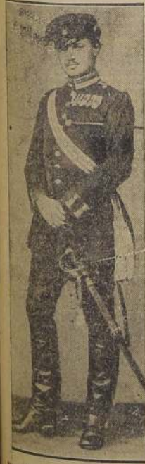
Von Hindenburg durante los comienzos de su carrera militar

Las noticias sobre el deceso del Presidente, se esparcieron lentamente a causa de lo temprano de la hora. Pero con el anuncio de Goebbels, los dueños de casa, los porteros de los edificios públicos y otros empleados semejantes comenzaron a izar las banderas negras o nazis con crespones de luto, y a media asta.