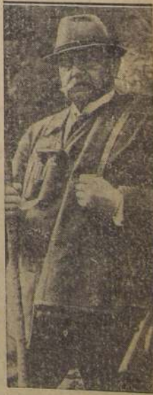
Su pasatiempo de caza en su finca

Goebbels anunció por radio que Hitler era el nuevo Presidente-Canciller de Alemania, bajo la misma nueva ley que autorizó la fusión de la Presidencia con la Cancillería, y que permitiera, además al nuevo mandatario personal-