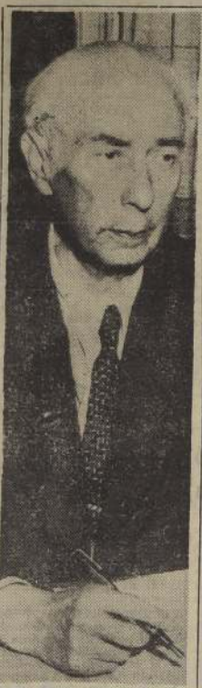
El Dr. Theodor Heuss, Presidente de Alemania.