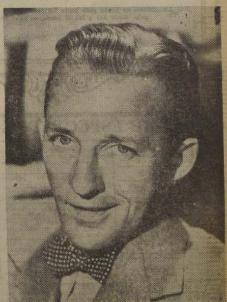
El cantante y actor Bing Crosby está siendo utilizado para presentar ante el público aficionado al cine, a una serie de estrellas de la Paramount, en la forma que por primera vez se utilizó en la cinta "Riding High".

pues que la señorita Wyman regrese de Inglaterra. —Greer Garson va a beneficiarse con el cambio de título en la película que ha terminado recientemente con Errol Flynn. La película en vez de llamarse "The Forsyte Saga", como la novela de que ha sido sacada, se denominará "That Forsyte Woman". —El productor Sol Lesser, que se hizo famoso con la serie de Tarzan, está muy alegre por el hecho de que 40.000 pies de película en color Kodachrome, filmadas en Sud América para una producción, fueron despachadas desde wood sigan el mismo sistema.