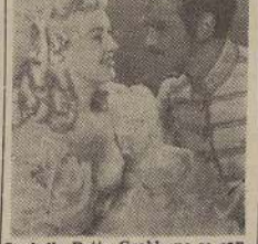
La bella Betty Grable no se cansa de admirar a su adorado Douglas Fairbanks, en la película "La condesa se rinde".