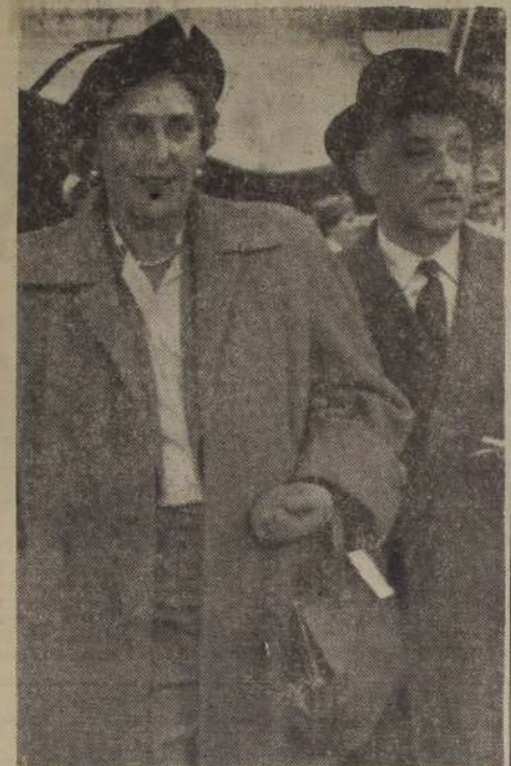
El Conde y la Condesa Marone, altos personajes de la aristocracia española, y muy vinculados con la familia real. Llegaron ayer a Santiago en un viaje de turismo por toda Sud América.