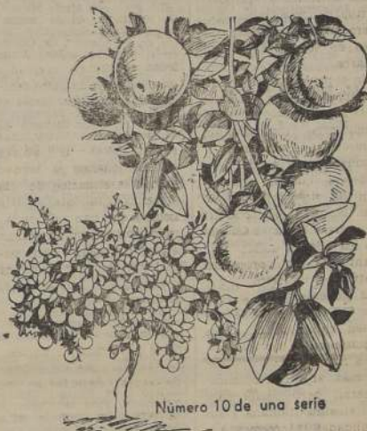
Número 10 de una serie