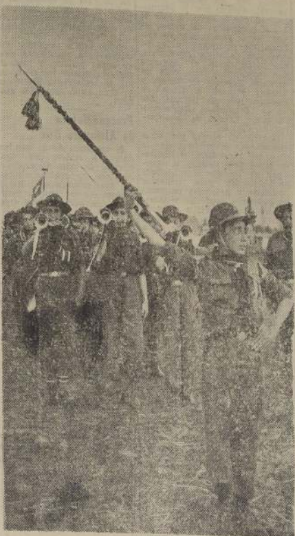
Los boy-scouts de Sewell, fueron sorprendidos ayer por LA NACION, mientras se preparaban para el desfile de hoy, que partirá a las 11 horas desde la Plaza Baquedano, hasta el monumento a O'Higgins.

terio de Defensa Nacional, Subsecretaría de Guerra, por asuntos que le interesan.