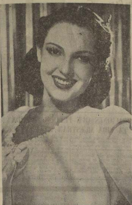
LINDA es linda de verdad. Y tiene una irresistible simpatía que da realce a su hermosura y le granja generales afectos.