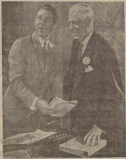
En el grabado aparece Danny Kaye en una de sus innumerables situaciones graciosas, las que serán demostradas hoy en el cine Central.

Una caravana de camiones cargados con miles de toneladas de reductores, cámaras, equipos de sonido, vestuario, tiendas de campaña, alimentos, medicinas, y personal técnico y artístico, se internó en lo más espeso de la selva