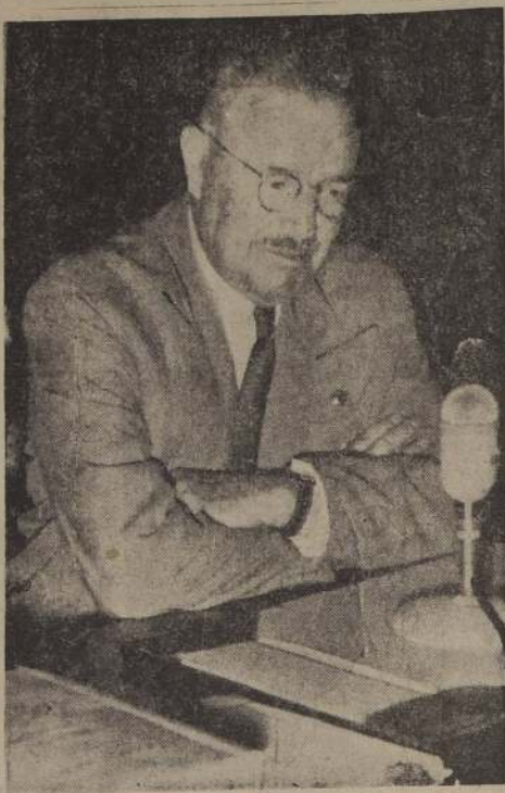
Mensaje al pueblo de Chile. — S. E. el Presidente de la República envió anoche un Mensaje al pueblo de Chile en el cual pide sacrificios por iguales a todos los chilenos para hacer la grandeza de la Patria. El grabado capta el momento en que minutos antes de medianoche el General don Carlos Ibáñez se dispone a leer su Mensaje al país.