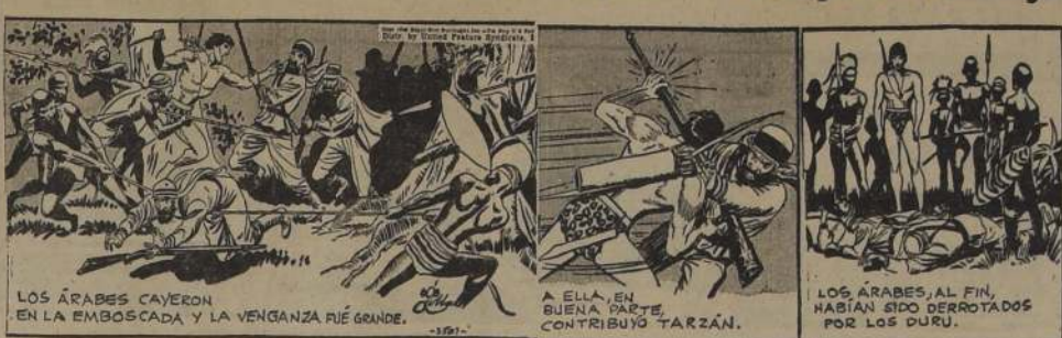
LOS ÁRABES CAERON EN LA EMBOCADA Y LA VENGANZA FUE GRANDE.

A ELLA, EN BUENA PARTE, CONTRIBUYÓ TARZAN.