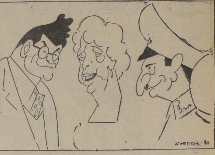
M. Jacques Doriot, Mrs. Roosevelt y el Rey Boris de Bulgaria, vistos por Romero

EL CAIRO, 4. — (U. P.). — Las tropas australianas, guiadas por tanques pesados, se abrieron paso hacia la línea de defensa más profunda de Bardia, y penetraron tres y medio kilómetros, según un comunicado oficial. La caída de la fortaleza, que los restos de cuatro divisiones italianas han sostenido durante tres semanas, parecía próxima, según los despachos recibidos del frente. Cinco mil italianos fueron apresados en esta primera fase del asalto final. Hay muchos muertos y heridos. Quedan en la ciudadela menos de 15.000 soldados, con orden de defenderse hasta el último, en un esfuerzo desesperado por salvar la plaza. Se ha indicado que la infantería, tanques y artillería australianos realizan casi todas las operaciones, apoyados por la Real Fuerza Aérea y los buques de guerra británicos, que han mantenido a las posiciones italianas bajo el fuego día y noche. Durante días enteros, los tanques, artillería y tropas de infantería en camiones se han dirigido hacia el oeste, a través del desierto egipcio, para tomar sus posiciones frente a Bardia, que está rodeada por una serie de poderosos fuertes, unidos por enmarcadas alambradas de púa y apoyados por una profunda trinchera contra tanques. Las fuerzas imperiales bombardearon el campamento de Bardia y concentraron el fuego de artillería sobre ese lado, en una ostensible preparación para un ataque por la infantería y los tanques. Tan