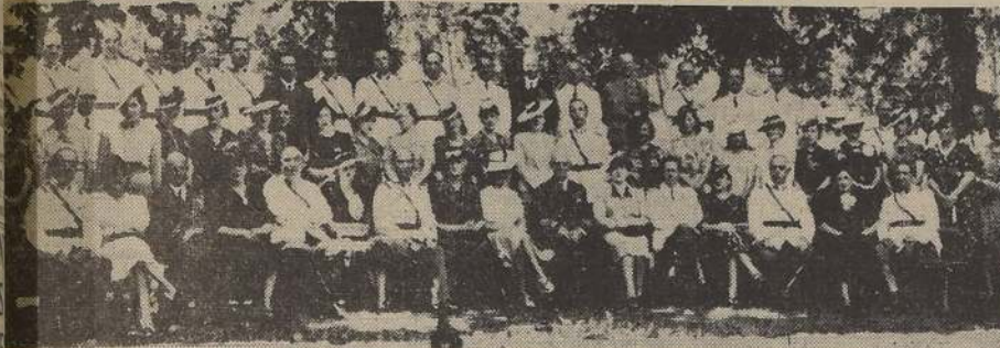
Asistentes al almuerzo ofrecido por las Fuerzas Armadas a los miembros militares de la Mision Britanica.