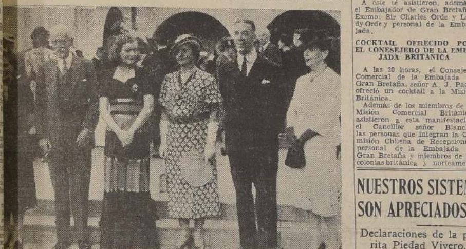
Asistentes al almuerzo ofrecido por el Consejo Comercial de la Embajada británica.