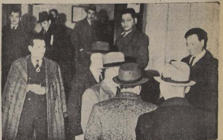
Algunos de los ciudadanos alemanes citados a declarar ayer, en los momentos en que llegan a la Oficina de la Secretaría General de los Servicios de Investigaciones.