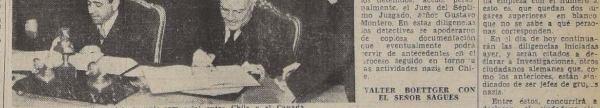
Durante la firma del convenio comercial entre Chile y el Canadá.

BANQUETE LES OFRECIO EL M. SR. ROSSETTI. El Ministro de Relaciones Exteriores, señor Juan B. Rossetti, ofreció ayer un gran banquete, en el Hotel Carrera, a los miembros de la Misión Comercial del Canadá, que preside el Ministro de Comercio de dicho país, señor Mac Kinnon, con motivo de haberse dado feliz término a las conversaciones tendientes a concertar un Tratado Comercial entre ambos países.