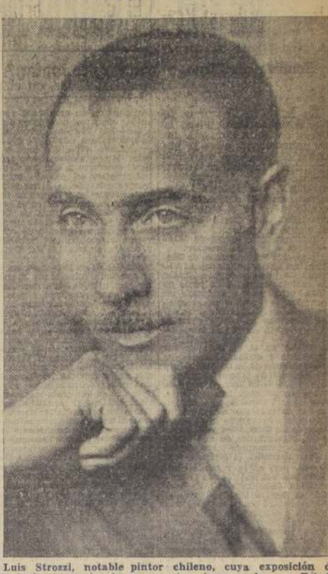
Luis Strozzi, notable pintor chileno, cuya exposición de paisajes y naturalezas muertas inaugurada en Estado 250, ha constituido un brillante acontecimiento artístico