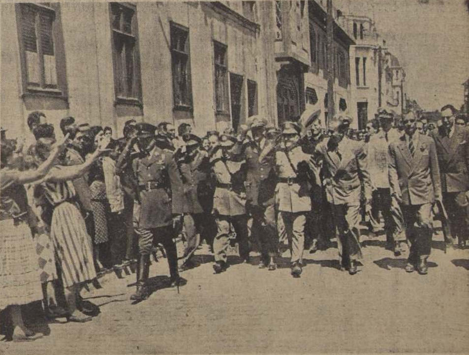
LOS VALDIVIANOS APLAUDEN AL PRESIDENTE. — Por las calles de Valdivia, marginadas de un público entusiasmo y cariñoso, el paso del Presidente González Videla tuvo caracteres apoteósicos. Los valdivianos lo han recibido alborzados, porque con su presencia culminan las festividades del cuarto centenario de la fundación de la ciudad. En la fotografía lo acompañan las autoridades y jefes militares de la provincia.

Pedirá al Congreso Nacional una ley que todos los practicantes antiguos deban tener sexto año de humanidades rendidos satisfactoriamente, certificando, por medio del Ministerio de Educación, para poder ejercer la profesión. Especialmente esta obligación será estricta para los miembros de la Federación Nacional.