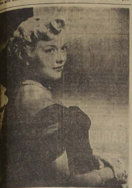
Esposa de Errol Flynn.— La joven actriz Patrice Wymore es la esposa de Errol Flynn. Tiene un cuerpo muy similar al de Esther Williams. Actualmente está filmando junto a Randolph Scott "Un hombre y una pistola".