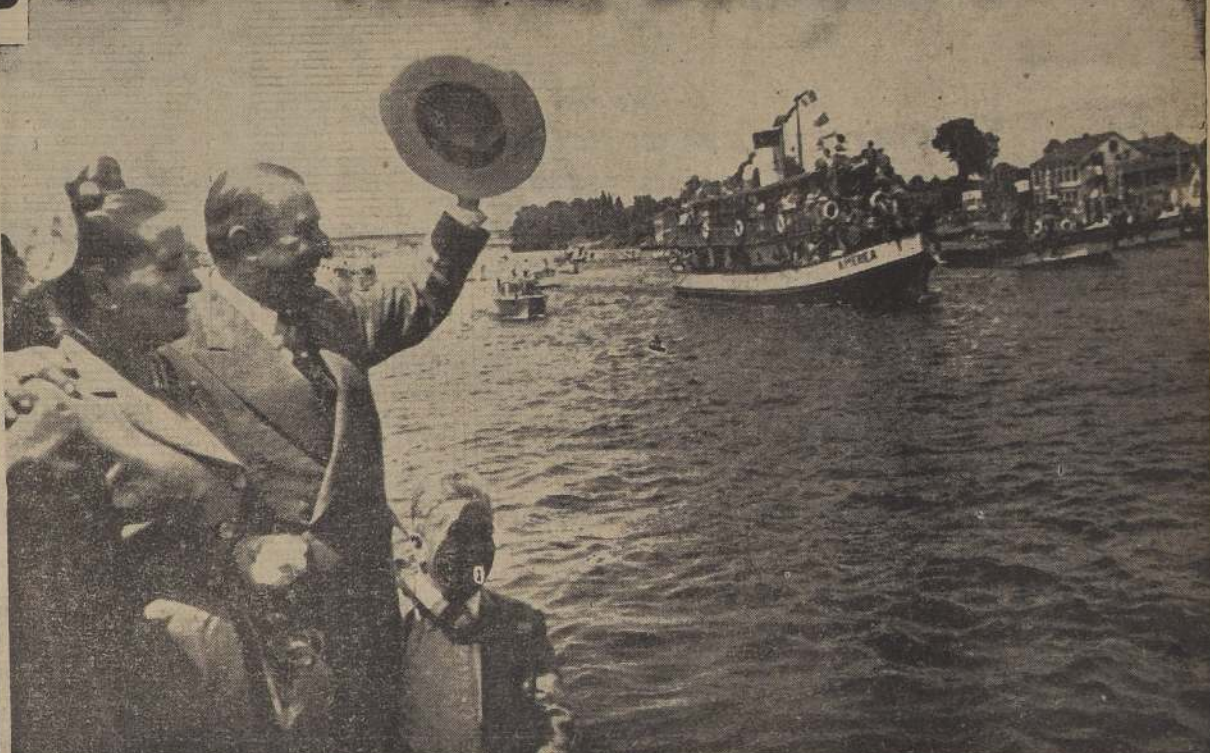
S. E. Y ESPOSA LLEGAN A VALDIVIA. — Por el río, en un barco que fué escoltado por cientos de embarcaciones embanderadas, llegaron al medio día de ayer a Valdivia el Excmo. señor Gabriel González Videla y su distinguida esposa. En la fotografía aparecen mientras agradecen las manifestaciones de simpatía que les tributan a su paso, y que luego se repitieron por las calles de la hermosa ciudad, con un entusiasmo y cariño extraordinarios.

DESFILE FLUVIAL. — Al dirigirse el Presidente de la República al vapor "Teja", que lo llevaría por el río al centro de la ciudad, pasó por un arco de copihues rojos levantado por el Club Aéreo. Al embarcarse S. E. y acompañantes, el "Teja" pasó por una verdadera "cortina" de agua tendida por las bombas fluviales "Chile" y "Valdivia".