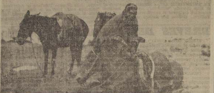
MULA APUNADA.— En la falda del monte Tupungato, se apunó una mula de la expedición del NAYS, que aparece atendida por un arriero que acompañó a los jóvenes metropolitanos.