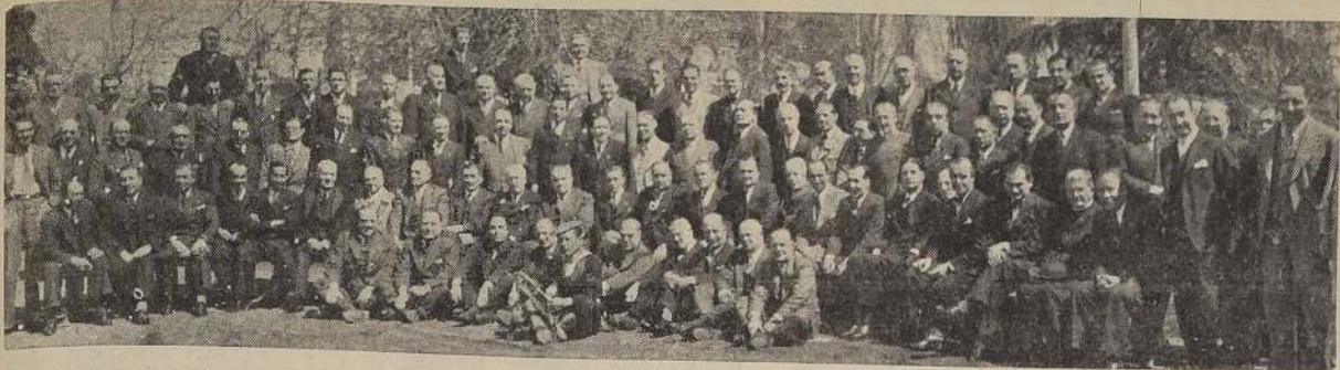
Asistentes al almuerzo de ayer en el Estadio Francés de los ex cadetes y ex oficiales de la Armada, con motivo del aniversario del Combate de Angamos