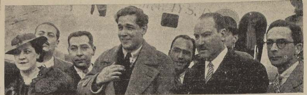
El artista mexicano Tito Guizar al llegar a Los Cerrillos, acompañado del Embajador de México, Excmo. señor Pérez Treviño.

El Embajador Excmo. señor Pérez Treviño y esposa, periodistas y artistas le dieron la bienvenida en los Cerrillos.— Un numeroso público tributó una entusiasta recepción al actor de "Allá en el Rancho Grande" . . . — Hoy ofrece un cocktail a los periodistas de la capital