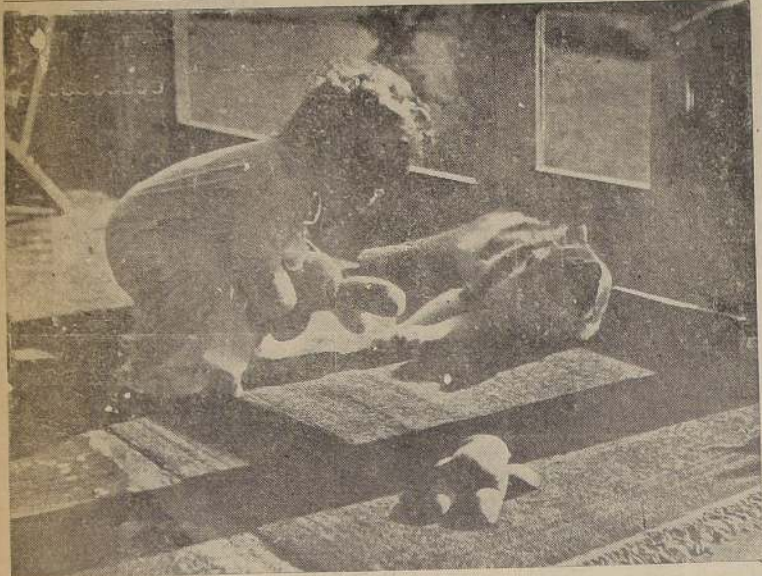
Esta fotografía, tomada por Charles P. Carr, mereció el primer premio en un concurso fotográfico realizado en Woodbridge (Connecticut).