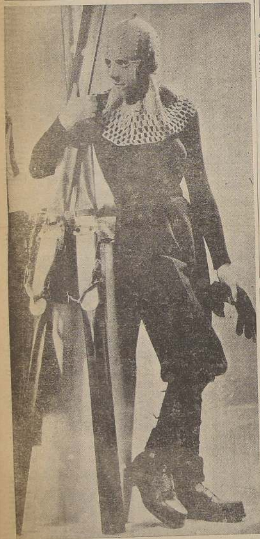
El último alarido de la moda para las aficionadas al sky es este traje, que más bien parece creado para un personaje de una película de fantasmas.