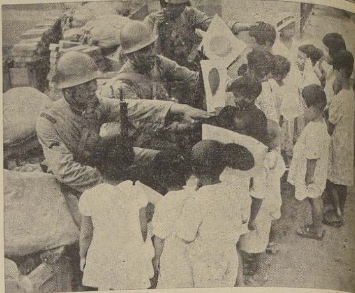
Después de la ocupación de Tientsin, los soldados japoneses comparten su postre con los niños chinos.