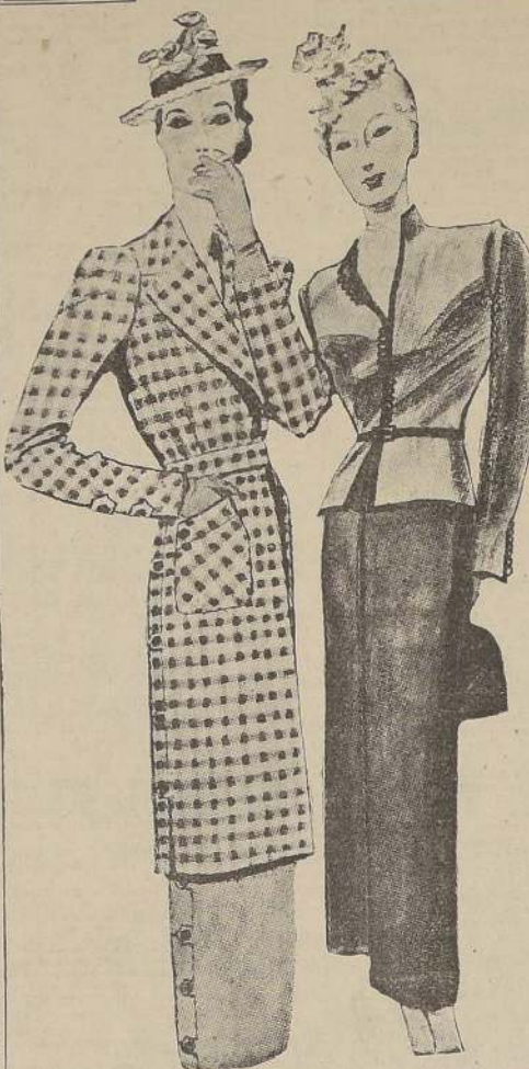
Dos grandes modistos parisienses, Creed y O'Rosen, han creado estos dos modelos para comienzos de primavera. Su principal característica es la moda del bicolor, ya que el modelo de Creed es rojo y negro, con la falda negra; y el de O'Rosen es a cuadros verde y marrón con la falda gris.