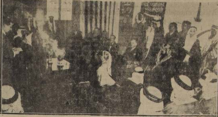
El Rey Ibn Saud realizó a principios del presente mes, una visita a los campos petrolíferos del Golfo Pérsico. La fotografía nos muestra una escena de la recepción al Rey en el aeropuerto. Acompañan al Rey el representante diplomático de Estados Unidos y el vicepresidente de la Arabian American Oil Company. (Foto ACME).