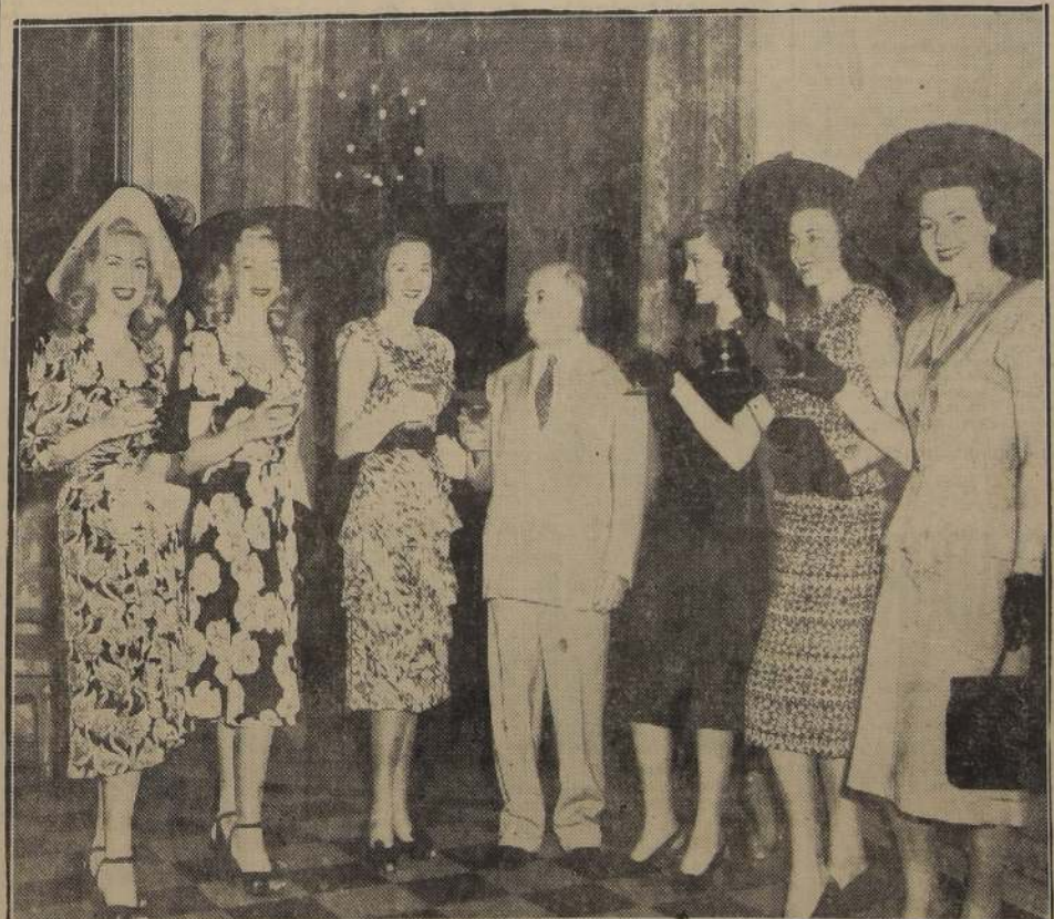
El próximo domingo llegarán a Chile las "Goldwyn Girls" que aparecen en esta fotografía con el Alcalde de La Habana, doctor Fernández Supervielle, durante una recepción en esa ciudad. La visita de este conjunto obedece al propósito del productor Sam Goldwyn de presentar en nuestra capital al famoso cómico Danny Kaye, quien aparece en el film del sello RKO, "Un hombre fenómeno" que será estrenado en el Teatro Central.