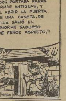
ZORK PORTABA RARAS ARMAS ANTIGUAS, Y AL ABRIR LA PUERTA DE UNA CASITA, DE ELLA SALIO UN ENORME SABUESO DE FERROZ ASPECTO.

VENDO FORD 29, CUATRO PUERTAS, motor recién ajustado, Batería nueva, García Reyes 342. 19 Feb