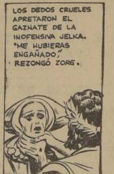
LOS DEDOS CRUELES APRETERON EL GAZNATE DE LA INOFENSIVA JELKA. "ME HUBIERAS ENGANADO", REZONGO ZORK.