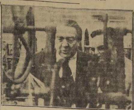
Ministro del Trabajo, señor Juan Pradenas, observa la elaboración del cobre en la Fábrica Madeco.

Durante su visita, el señor Pradenas fue acompañado por los dirigentes industriales, señores