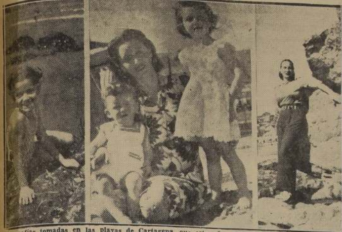
Fotografías tomadas en las playas de Cartagena, que este año, como los anteriores, se han visto muy concurridas.