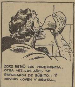
ZORK BEBO CON VENEMENCIA. OTRA VEZ, LOS AÑOS SE ESFUERZAN DE SUBITO... Y DEVINO JOVEN Y BRUTAL.