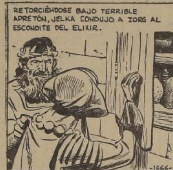
RETORCIENDOSE BAJO TERRIBLE APRETON, JELKA CONDUJO A ZORK AL ESCONDIRTE DEL ELIXIR.