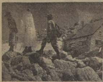
La llegada a la cabaña.

Es una idea como otra; pero que tiene el mérito de ser original. Un joven alpinista ha querido sellar su amor en la cima del monte d'Orny, a 3,450 metros de altitud, en el macizo de Trient.