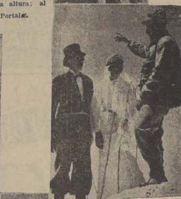
La bendición en la cima d'Orny, por un guía amigo

Para llegar a la cabaña el camino es fácil; pero la joven pareja escogió otros caminos que les permitían estar más en contacto con la montaña.