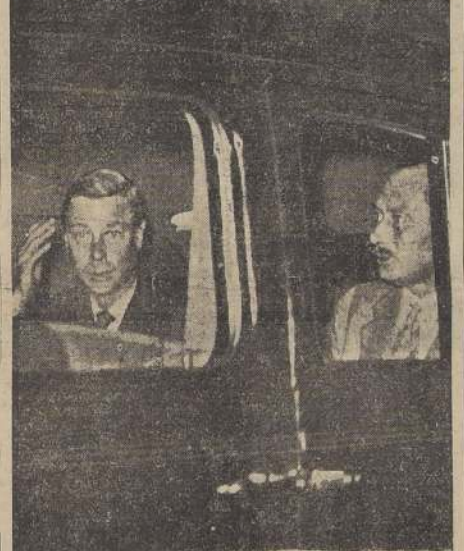
Fotografía tomada en el momento en que los Duques de Windsor y Gloucester llegan al hotel del primero en el boulevard Suchet, (del "Paris-Soir", del domingo) llegado por correo aéreo de la Air-France

(Correspondencia de Joseph Ravotto, exclusiva para "LA NACION") ROMA, 17. (Especial).—El fascismo ha tendido su mano derecha para repatriar el mayor número posible de los 12.000.000 de personas nacidas italianas que viven en el extranjero, y que aún se consideran como súbditos italianos. Esto se hará mediante la creación del nuevo organismo llamado Comisión Permanente para la Repatriación de los Italianos en el Extranjero.