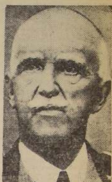
El Rey Victor Manuel de Italia, cuyo natalicio celebran hoy todos los italianos