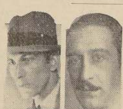
A. Flores R. Frontaura

Interesante será el debut de la Compañía Nacional de Comedias "Alejandro Flores", que se verificará esta noche a las 10 P. M. en el Teatro La Comedia. Alejandro Flores, la figura más destacada del teatro chileno ha sabido rodearse este año de elementos de mérito y con ellos afrontará la responsabilidad de la novena temporada anual de comedias. El entusiasmo del público ante la reaparición de Flores es manifiesta y así lo demuestra el hecho que está totalmente vendido el teatro para el debut de esta noche. "Nuestra Natacha", comedia en 3 actos, el segundo dividido en 3 cuadros, original del laureado autor español Alejandro Casona servirá para la presentación de la Compañía.